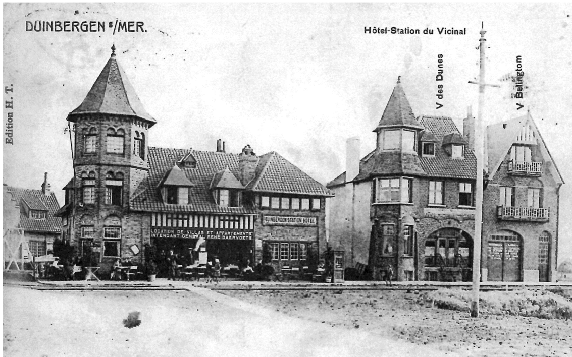
Afb. 4: Het eerste hotel en de eerste villa's in het duinengebied (privéverzameling)

naam verworven als intellectueel die zijn leven lang had gestudeerd en gepubliceerd over diverse onderwerpen, onder de schuilnaam "Spectator". Hij was ook mecenas en steunde royaal kerkelijke organisaties en weldadigheidsinstellingen. 9