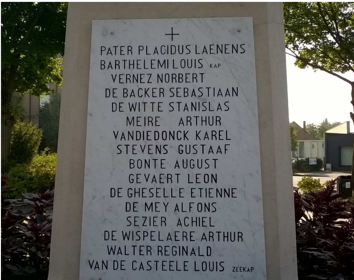
Figuur 86. Monument Assebroek