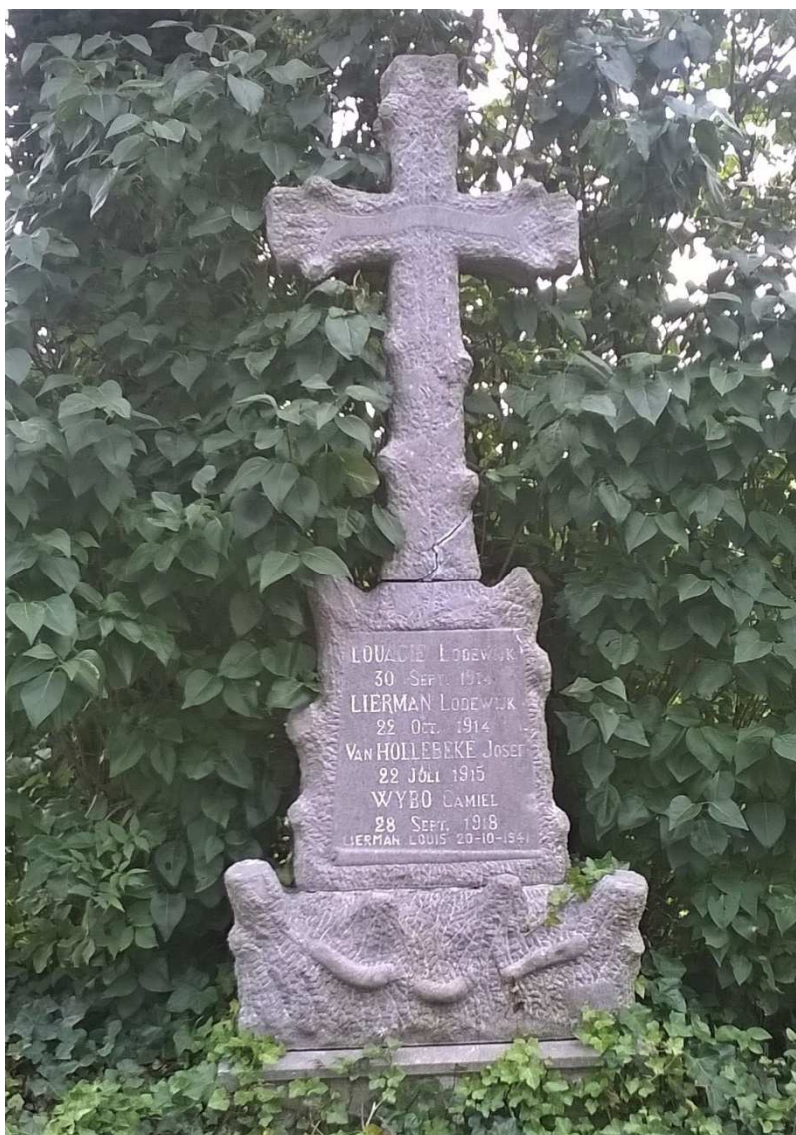
Figuur 82. Gedenkkruis voor de militaire slachtoffers, Meetkerke, kruispunt Oude Molenweg en Dorpweg

Achteraan in het midden op het kerkhof, naast de Onze-Lieve-Vrouwkerk, op het kruispunt Oude Molenweg en Dorpweg staat een gedenkkruis voor de militaire slachtoffers (figuur 82). Op een driedelige, geprofileerde sokkel, die naar boven toe versmalt en opgebouwd is uit gesculpteerde boomstammen staat een kruis eveneens bestaande uit boomstammen met afgehouden takken. Het monument is volledig uitgevoerd in hardsteen 324 . Op het kruis dat versierd is met klimmende wijnranken staat de tekst: "Aan onze helden" en op de sokkel staan de namen van de slachtoffers uit WO I en daaronder één naam uit WO II. Gans onderaan op de sokkel, verstoken achter de begroeiing staat "1914-1918" met daartussen in reliëf een helm tegen de achtergrond van een gekruist vaandel en een sabel.