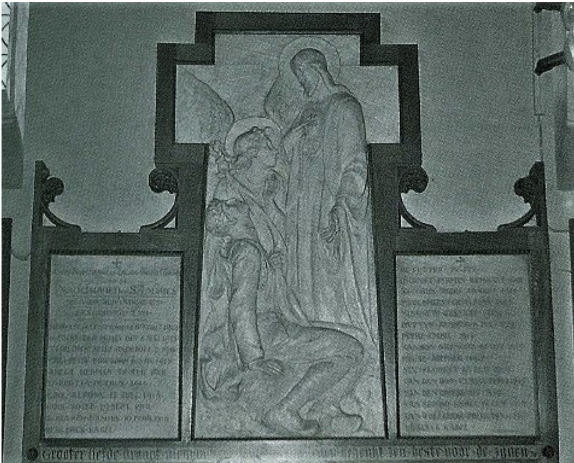
Figuur 75. Gedenkplaat voor de slachtoffers van WO I die zich vroeger binnenin de Sint-Andries en Sint-Annakerk in de Gistelsesteenweg in Sint-Andries bevond - bron: JACOBS M., Zij, die vielen als helden... Inventaris van de oorlogsgedenktekens van de twee wereldoorlogen in West-Vlaanderen, Deel 2, Brugge, 1996, p.359

Het betrof een gedenkplaat in de vorm van een vast drieluik omgeven door een geprofileerde en versierde houten omlijsting, met een verhoogd middendeel dat de vorm van een kruis met korte armen had. In dit middendeel stond een wit beschilderd gipsen hoogrelief waarop Christus van het Heilig Hart stond met een stralend aureool, de ene hand op zijn hart houdend en de andere hand geopend. Voor hem lag een getroffen soldaat met een lauwerkrans rond het hoofd en een vaandel in de hand. De soldaat werd ondersteund door een engel in lang gewaad met gespreide vleugels en lange haarlokken en een aureool achter het hoofd. Met een min of meer smekend gebaar richtte de engel zich tot Christus. De twee zijpanelen waren voorzien van witmarmere tekstplaten. Op het linkerluik stond de tekst: “Tot Roemrijke en Zalige Gedachtenis van de Parochianen van S t Andries, die voor hun Vaderland gestorven zijn” en daaronder de namen van de slachtoffers, alfabetisch gerangschikt. De namen vervolgden op het rechterluik. Op de houten boord onderaan de gedenkplaat stond de tekst: “Grooter . liefde . draagt . niemand . toe . dan . die . zijn . leven . schenkt . ten . best . voor . de . Zijnen” 295 . De voorstelling met Christus, de engel en de soldaat was identiek als