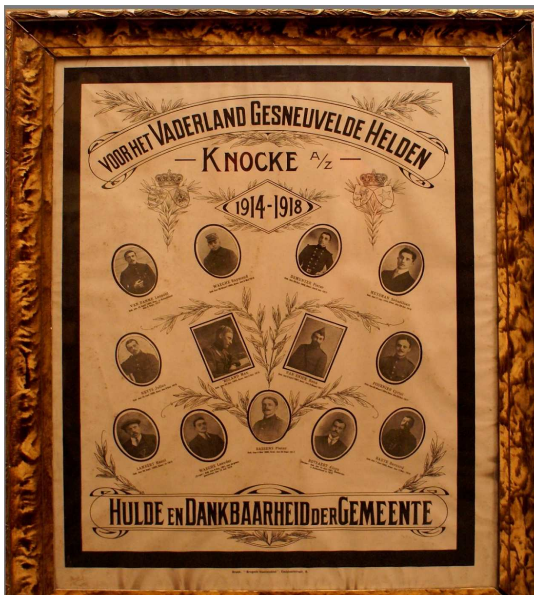
Figuur 44. "Memento" voor de militaire slachtoffers uit W.O. I