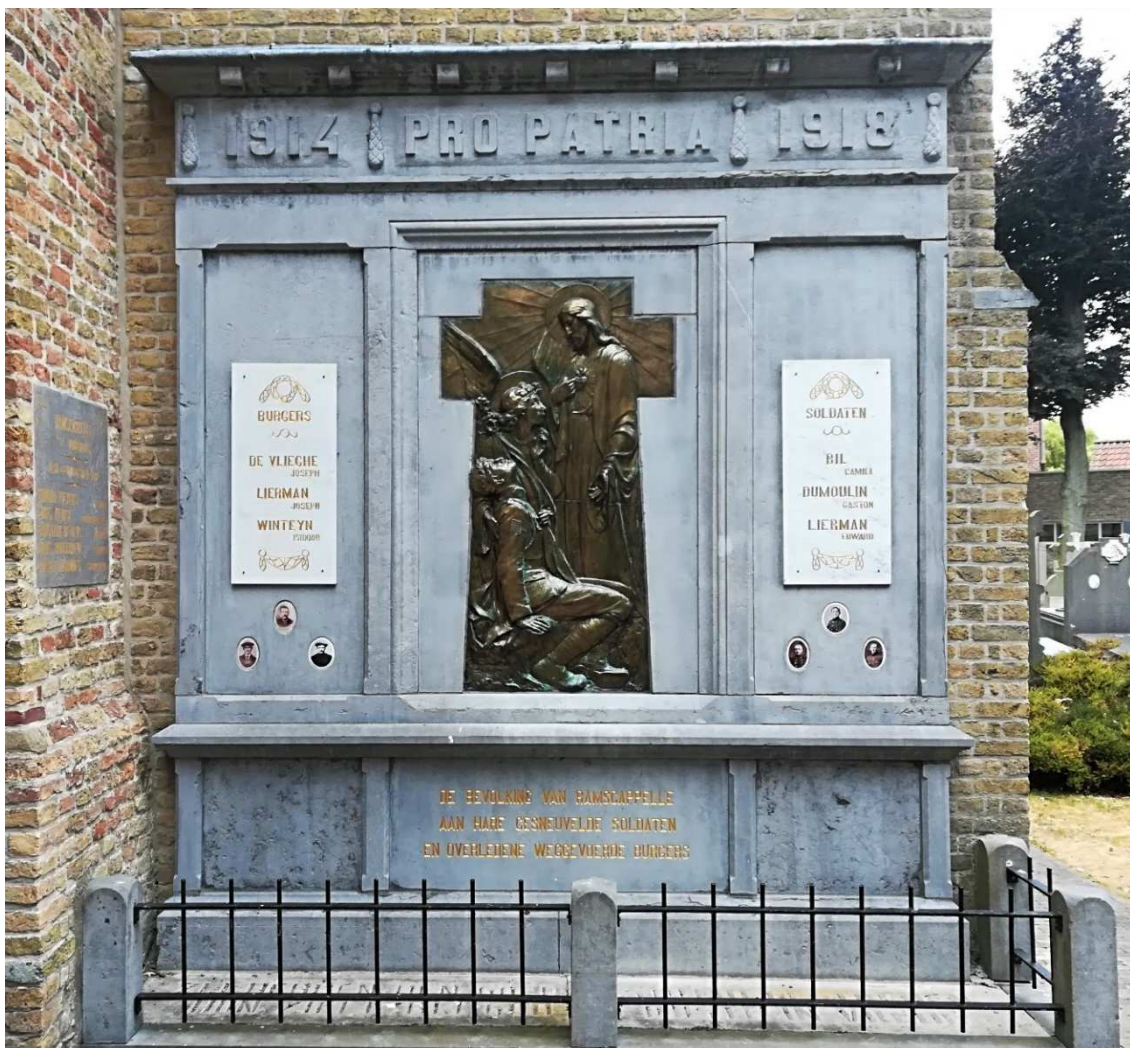
Figuur 45. Gedenkplaat voor de slachtoffers van de Eerste Wereldoorlog uit Ramskapelle, Ommegang, Sint-Vincentiuskerk (rechterzijmuur buiten de kerk), Ramskapelle

bronzen plaat aangebracht in de vorm van een kruis met een reliëfvoorstelling, waarop Christus van het Heilig Hart staat met een stralend aureool achter zich, de ene hand op het hart, de andere geopend. Voor hem ligt een getroffen soldaat met een lauwerkrans rond het hoofd en een vaandel in de hand. De soldaat wordt ondersteund door een engel in lang gewaad met gespreide vleugels, lange lokken en een aureool achter het hoofd. Met een min of meer smekend gebaar richt hij zich tot Christus. Op de grond ligt een tegelvloer van faïence, met daarop bruine letters die wit omrand zijn op een gele achtergrond, versierd met een veelkleurige boord en blauwe bloemen. Bovenaan staat de tekst: "1914 Pro Patria 1918" met daartussen enkele bloemenslingers. Onderaan op de gedenkplaat staat "De bevolking van Ramscappelle aan hare gesneuvelde soldaten en overledene weggevoerde burgers". Op de linkerkant naast de bronzen plaat met de reliëfvoorstelling bevindt zich een witmarmeren plaat met de namen van de burgerslachtoffers en drie portretten op porselein.