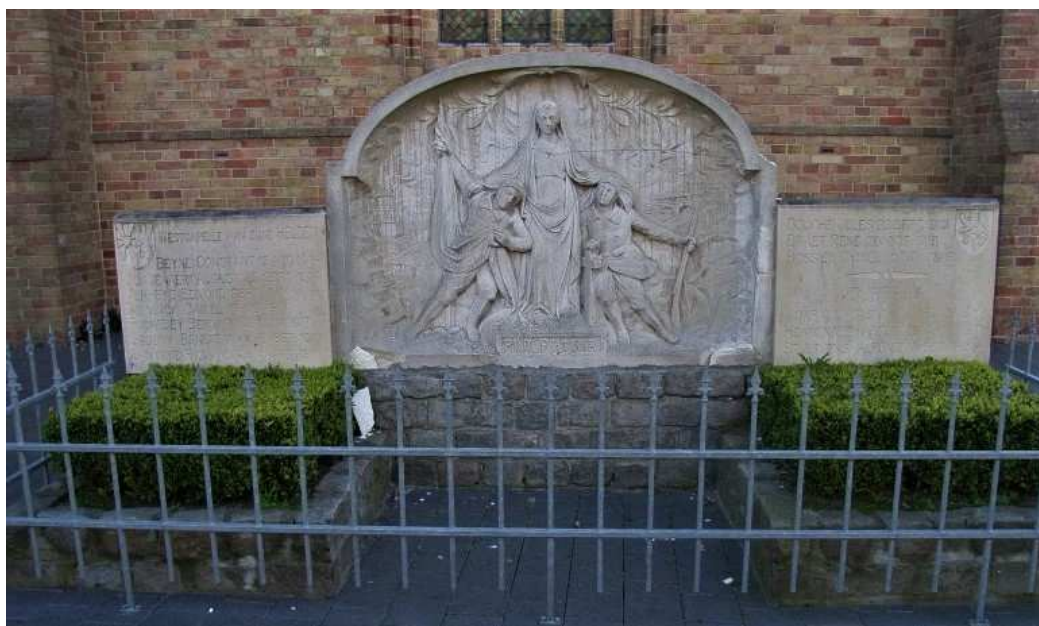
Figuur 49. Gedenksteen voor de militaire en de burgerlijke slachtoffers van Wereldoorlog I, Dorpsstraat, Westkapelle