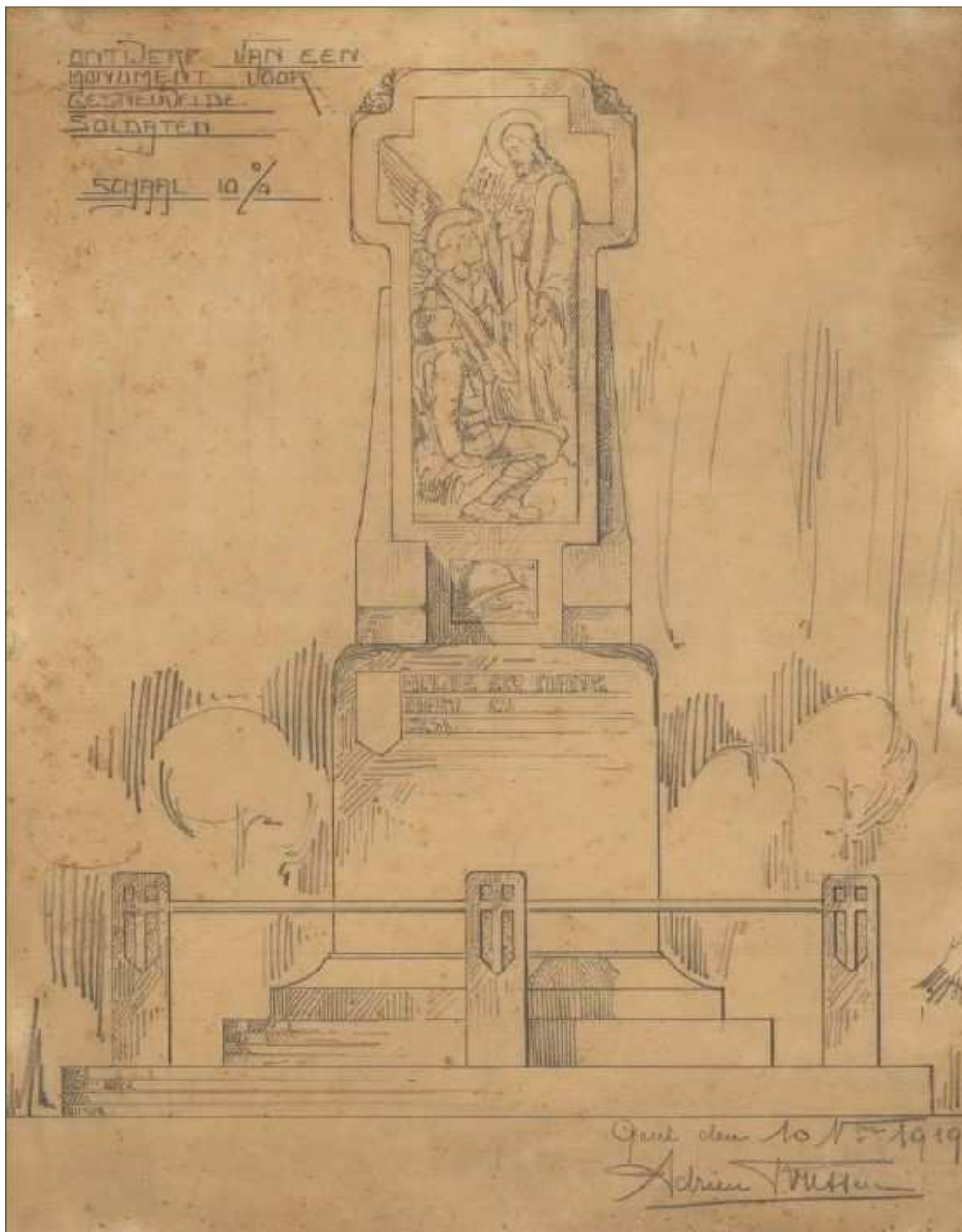
Figuur 46. Ontwerptekening uit 1919 van een monument voor gesneuvelde soldaten uit de Ateliers Bressers & Blanchaert, gesigeneerd: Gent, 10 november 1919 © Rie Vermeiren, De plaasteren beeldencollectie van de ateliers Bressers & Blanchaert, KADOC 17 december 2010, slide 41; https://www.slideshare.net/liezdeclus/r-vermeiren-bressersblanchaert20101217 )

uitgevoerd en hebben steeds dezelfde basisvorm, namelijk een breedarmig kruis dat aan de basis iets verbreed is 183 .