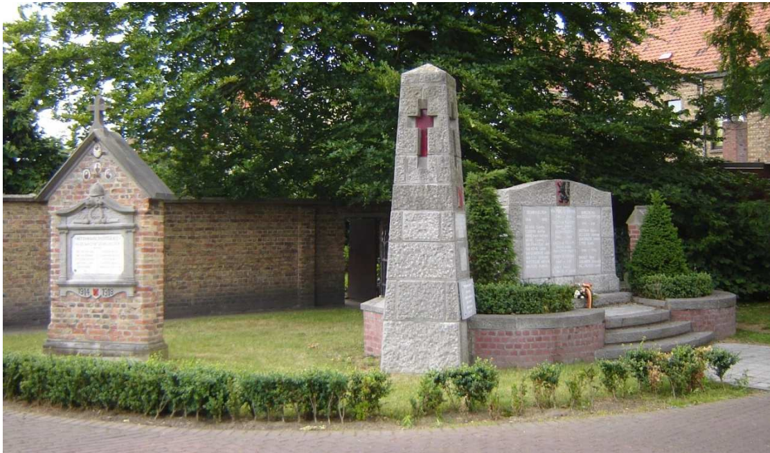
Figuur 27. De beide monumenten in Sijsele, Dorpsstraat, op het plein achter de voormalige pastorie en het gemeentehuis