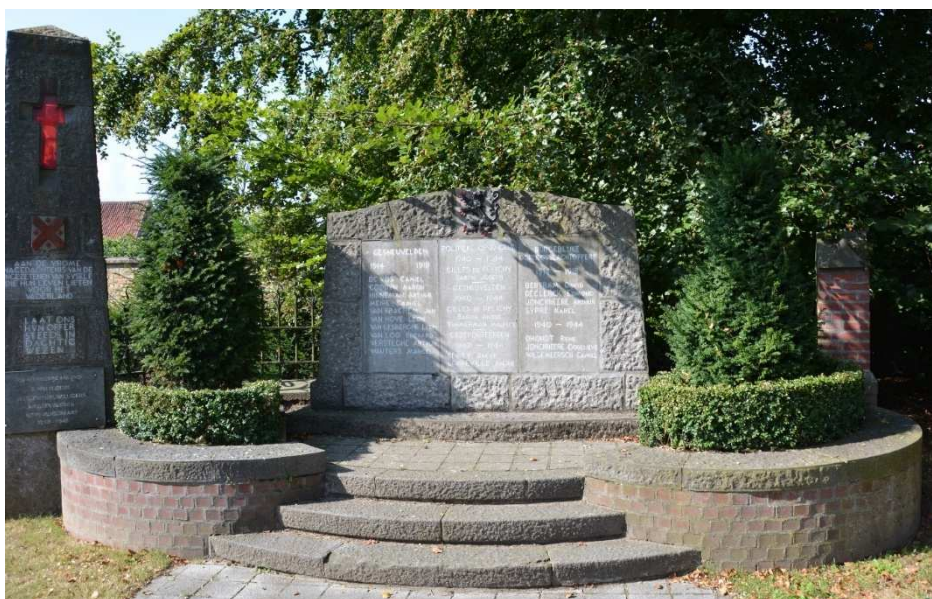
Figuur 25. Gedenkteken voor de slachtoffers van WO I en WO II, Sijsele, Dorpsstraat, op het plein achter de voormalige pastorie en het gemeentehuis, tegen de oostzijde van de tuinmuur van de huidige pastorie