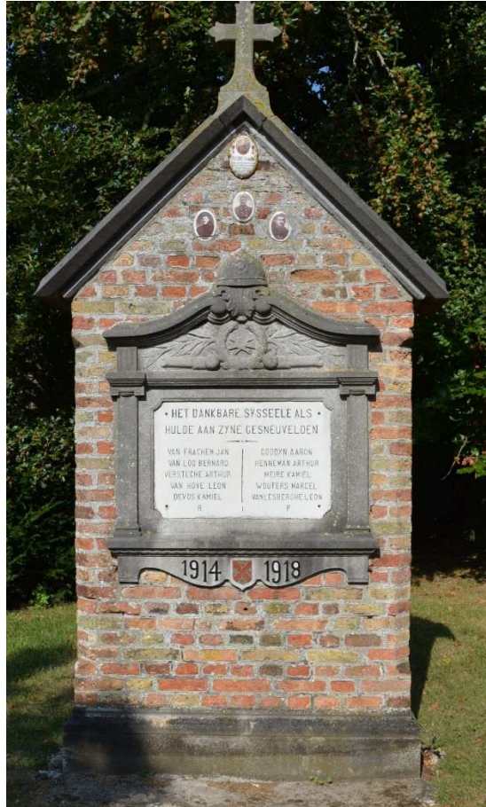
Figuur 26. Gedenksteen voor de militaire slachtoffers uit WO I, Sijsele, Dorpsstraat, op het plein achter de voormalige pastorie en het gemeentehuis