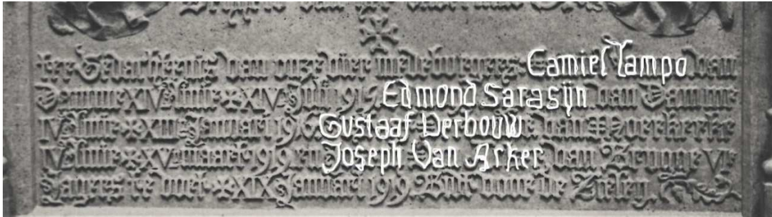
Figuur 17. Foto van de gedenkplaat voor de militaire slachtoffers van Damme vóór de plaatsing aan het stadhuis (23/07/1922); detail met aanduiding van de erop vermelde namen door de auteurs