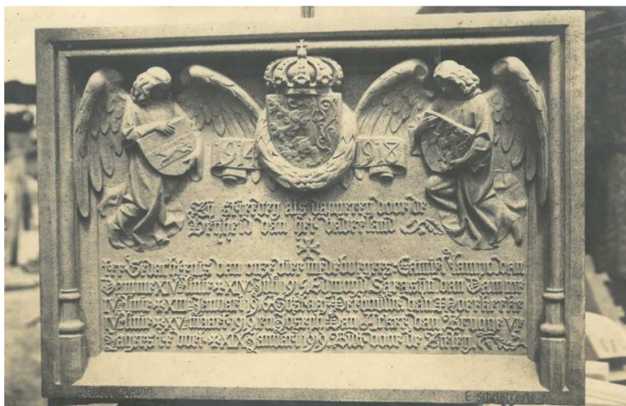
Figuur 16. Foto van de gedenkplaat voor de militaire slachtoffers van Damme vóór de plaatsing aan het stadhuis (23/07/1922)