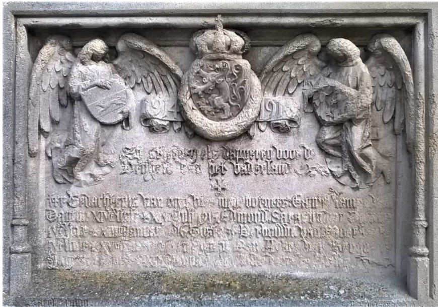
Figuur 15. Gedenkplaat voor de militaire slachtoffers van Damme, naast het stadhuis, Damme, Markt

Oorspronkelijk was deze gedenkplaat aan de voorkant van het trappenbordes van het stadhuis geplaatst 93 . De onthulling ervan vond plaats op zondag 23 juli 1922 94 (figuur 18).