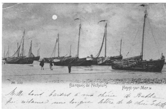
Vissersschuiten op het Heistse strand