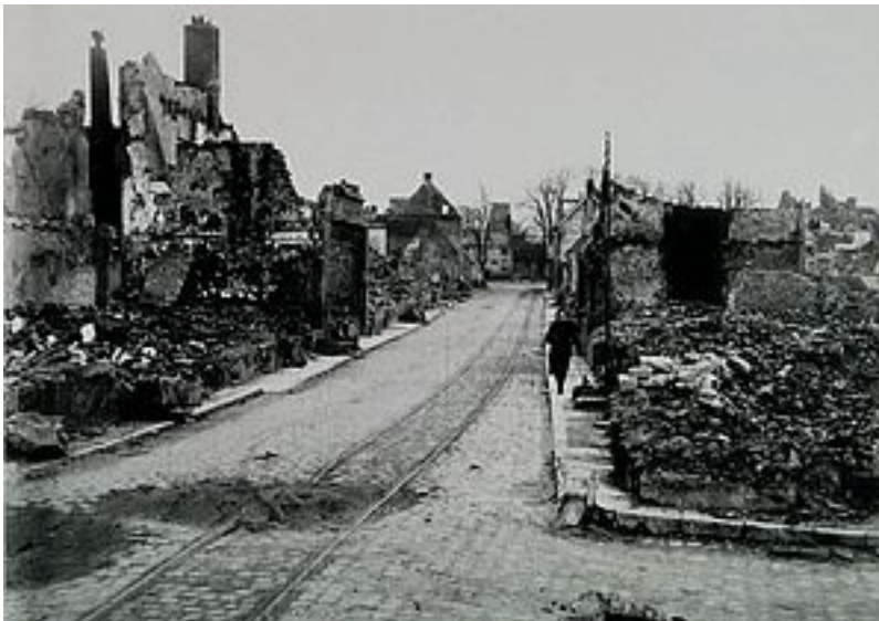
De Kapellestraat in een puinhoop herschapen (1944)