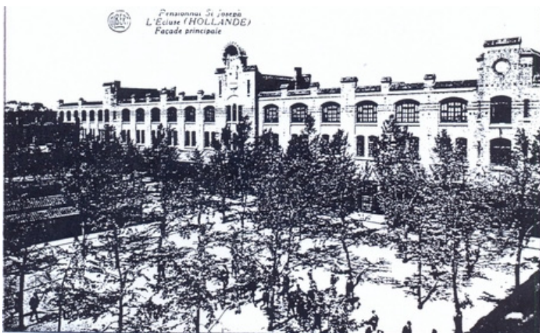
Het “Pensionnat Saint Joseph” te Sluis (1908-1940)