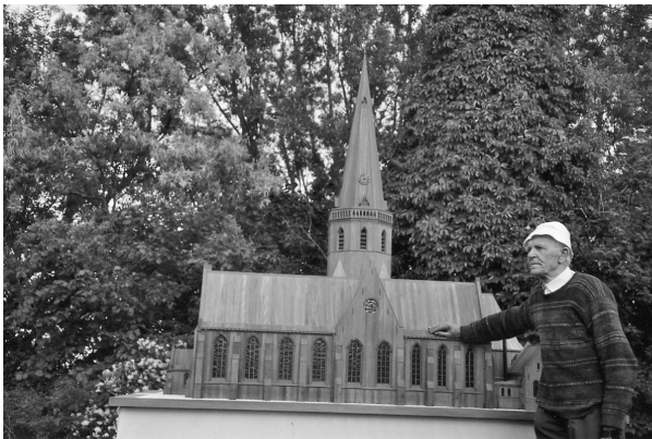
De maquette van de kerk