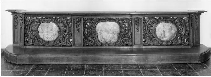
Het centrale gedeelte van de communiebanc uit de 18 de eeuw