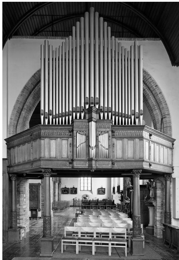
Orgel en doksaal