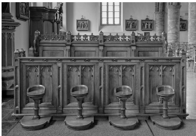
Zitsel van de dismeesters