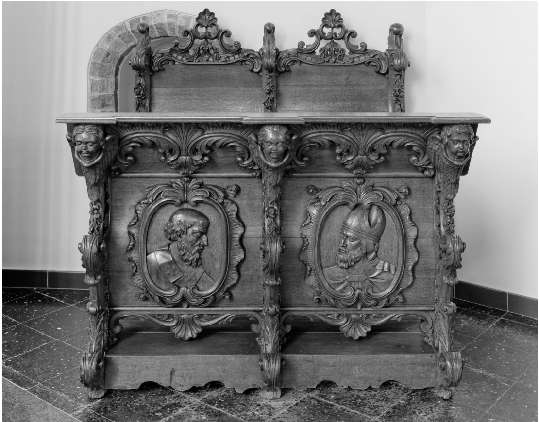
De koorgestoelten van de kerkmeesters