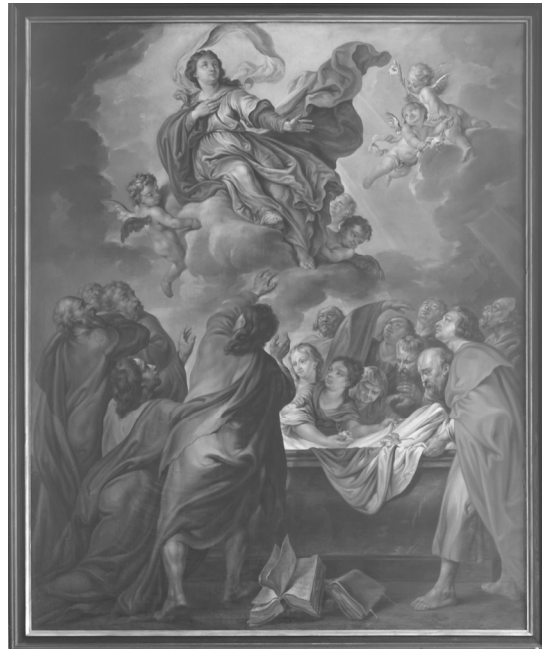
De ten hemel opneming van Maria