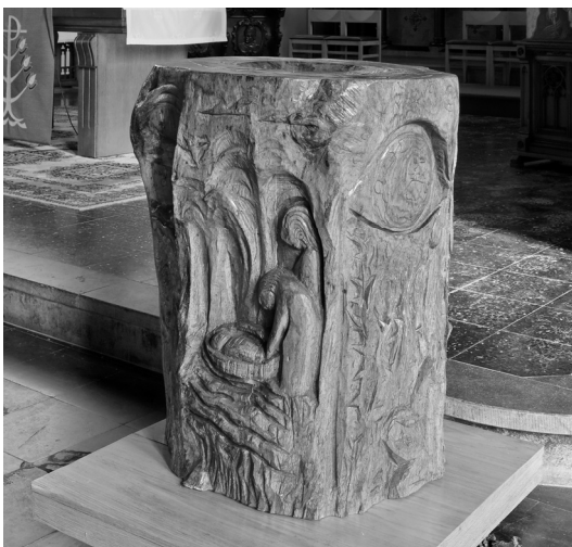
Doopvont van Omer Gielliet