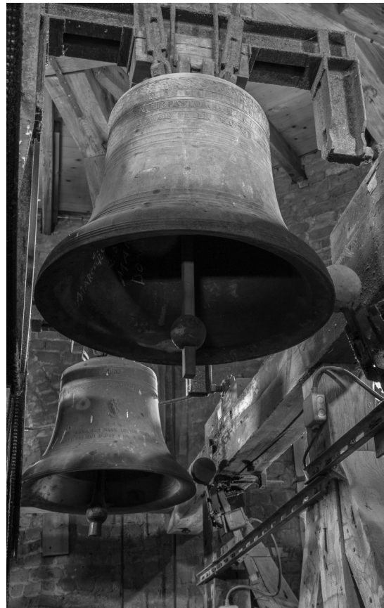
Boven: de klokken Jozef en Maria