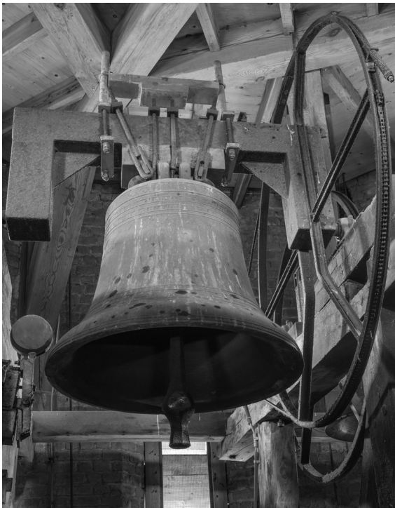
Links: De klok Nikolaas