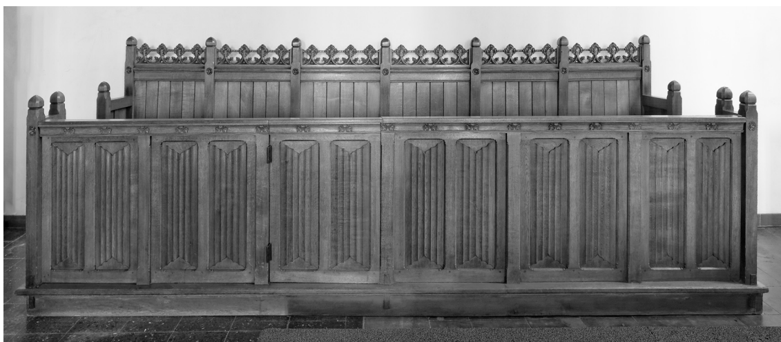
Boven: Het zitsel van de Sint Niklaasmeesters