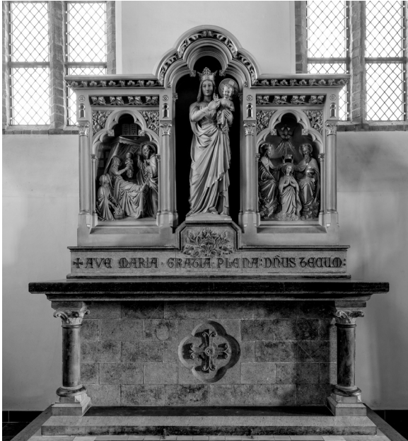
Het O.L.Vrouw altaar