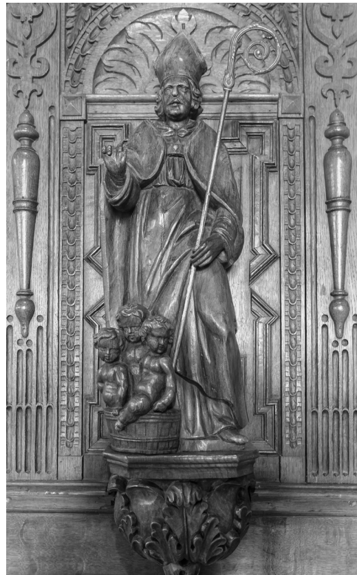
Het beeld van Sint Niklaas op de biechtstoel (1648)