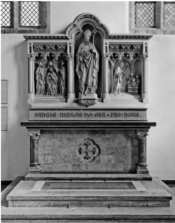
Het Sint Niklaas altaar