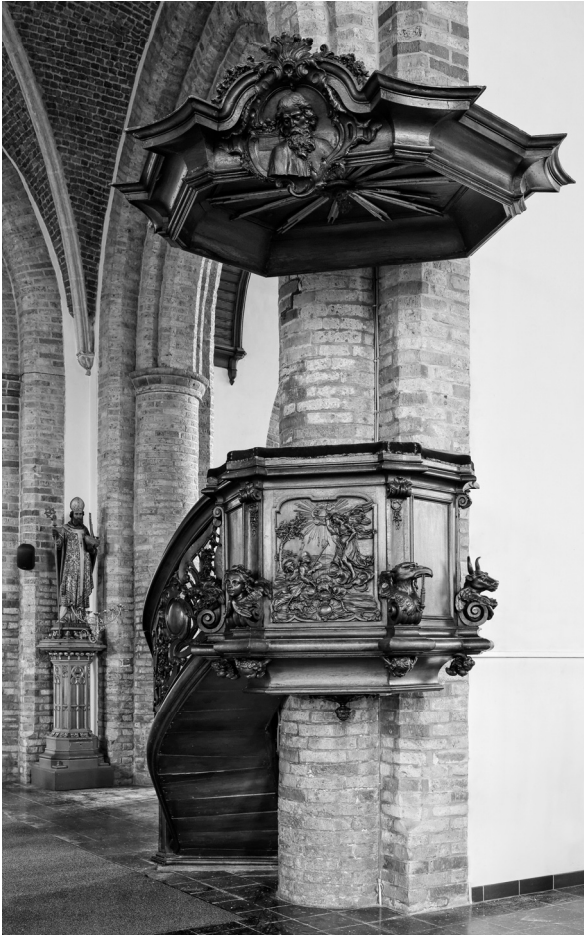
De preekstoel met klankbord