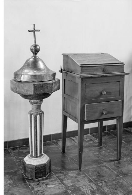
De doopvont uit 1830