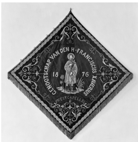
Links: Het vaandel van Sint Franciscus Xaverius