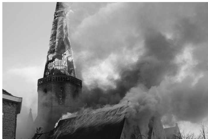
De brandende toren

Ca. 15.40 u. begon uit de dakkapel onder het kruis van de toren ook een rookpluim te walmen. Wat later perste rook door de nerven van de torenspits en weldra stond de hele spits gehuld in een dikke witte rookwolk. Kort daarop was de rookwolk helemaal zwart en de wind waaide die weg over de kerk in de richting van de zuidwestkant van de kerk.