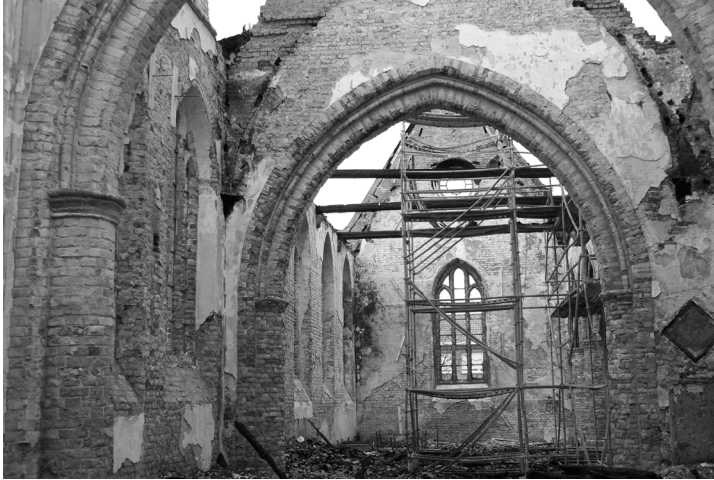
Zicht op het uitgebrande interieur van de kerk

juist doorkomen voor ze helemaal werd afgesloten. "Alles was zwart gerookt op de weg en op de kerkmuren".