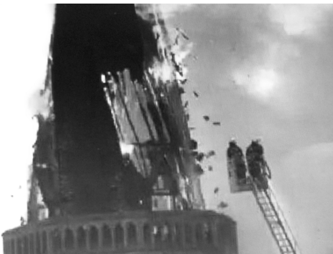
Bluswerken aan de toren

Nadat ik het wagentje en priester Gaspard in handen van Simonne had gegeven, bleef ik ook kijken naar de ramp. In plaats van een rookkolom zag ik nu een geweldige gloed van vuur in de klokkenzolder en weldra stond ook de torenspits in lichterlaaie. Het moet rond 16 uur geweest zijn. Kort daarna stortte de spits in. Hij zakte a.h.w. in de toren naar beneden, opgeslokt door het vuur. Op het laatst kantelde hij licht naar het