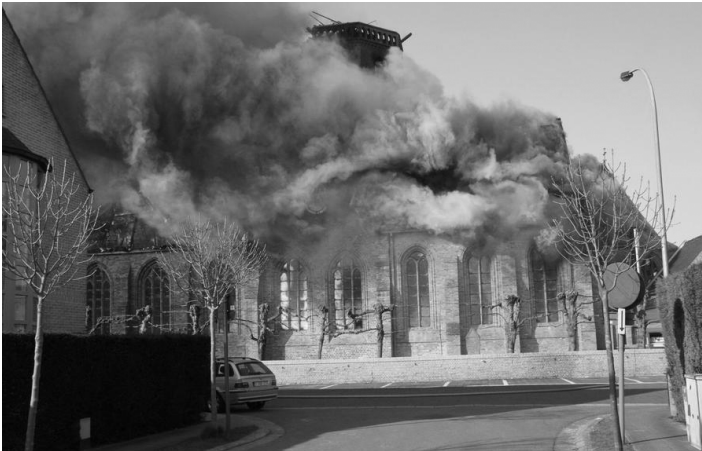
Brand in het schip van de kerk

Een omstaander liep onmiddellijk naar de kerk want hij had gezien dat een