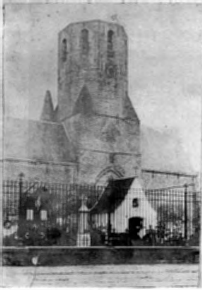
Afb. 1.: Oude foto van de Sint Niklaaskerk met op de voorgond de kalvarieberg