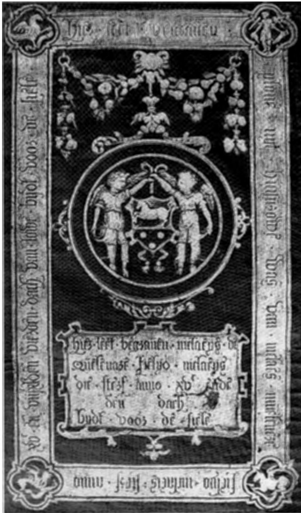
Afb. 2b. Frottis van de grafsteen van Nyt – De Meulenaere