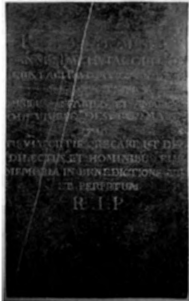
Afb. 7 Grafsteen van pastoor Joannes-Baptista Coulmon