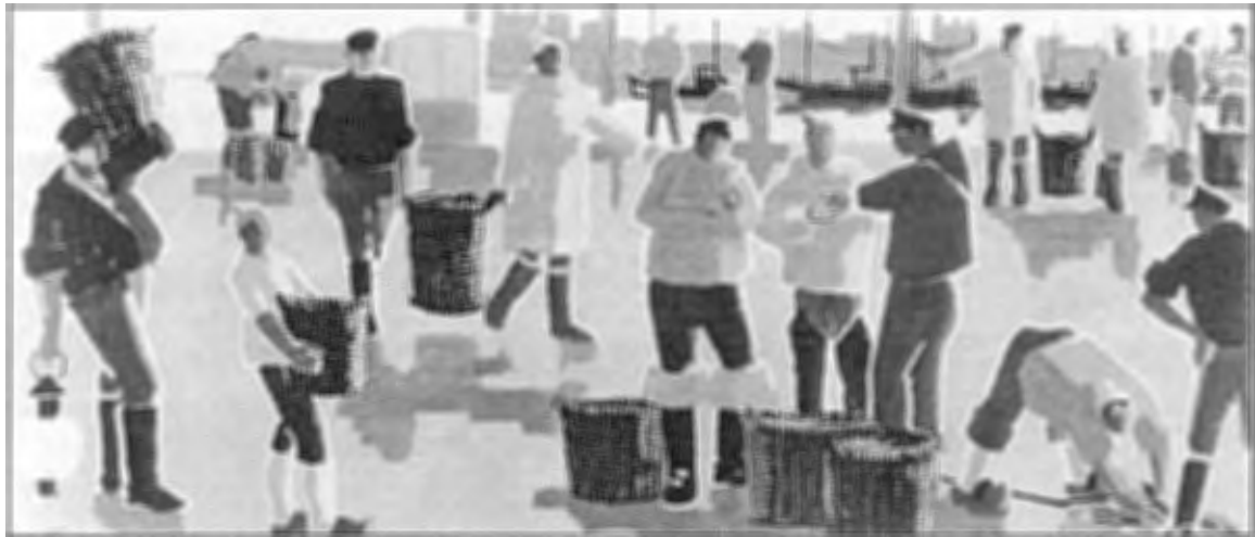
Retour de pêche, 1968, schilderij.