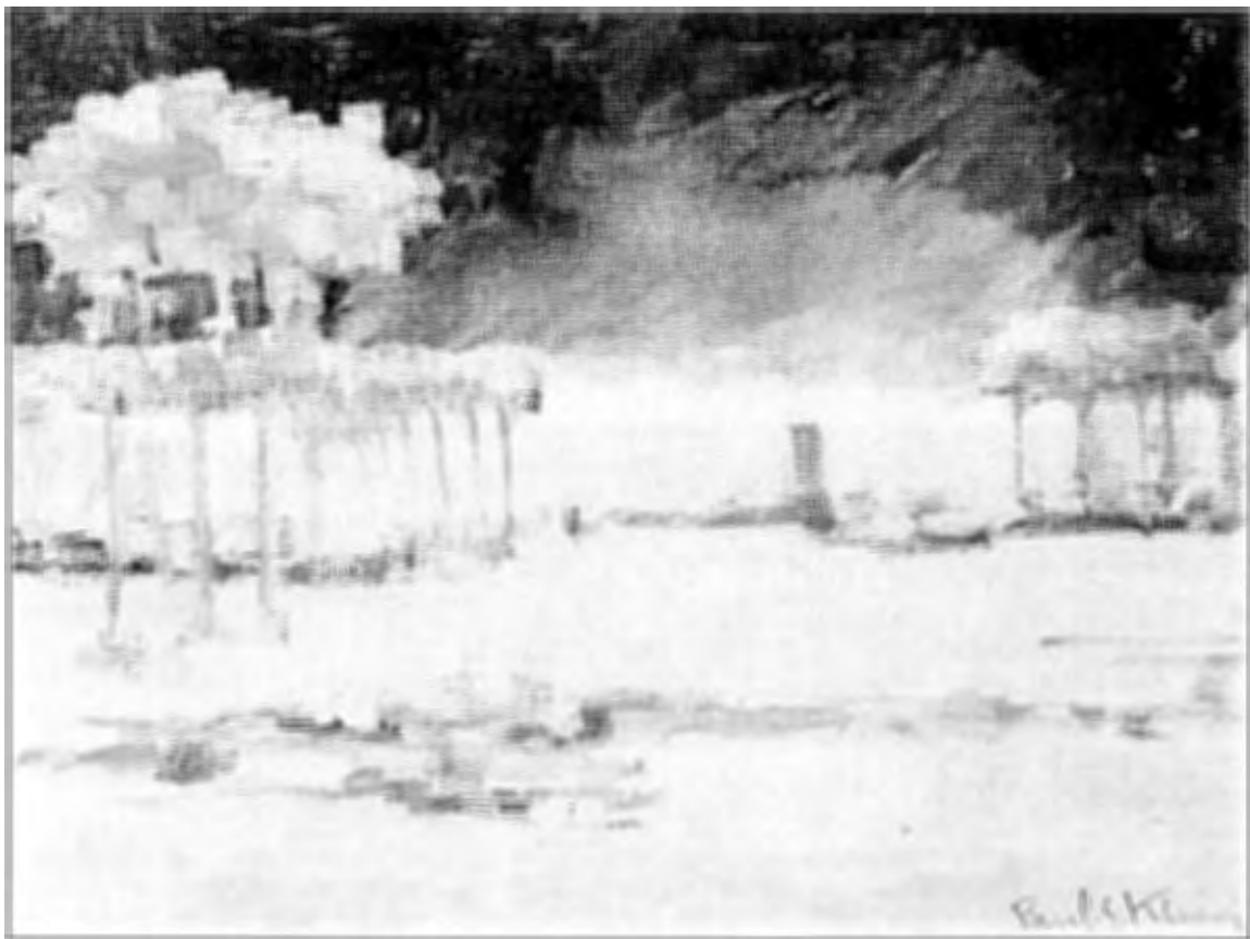
Paysage d'hiver, schilderij.