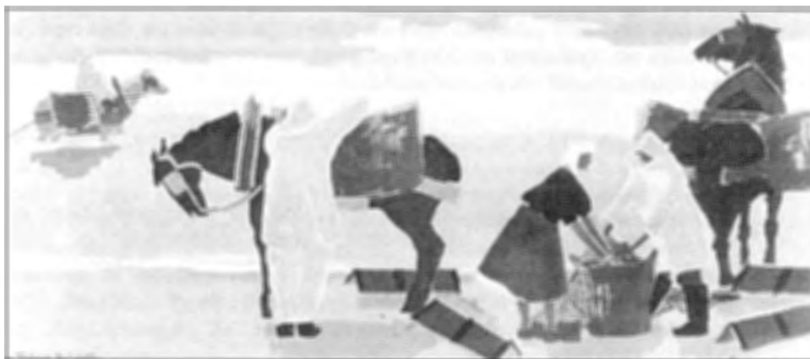
Les pêcheurs de crevettes, 1968, gouache op papier, 34 x 76