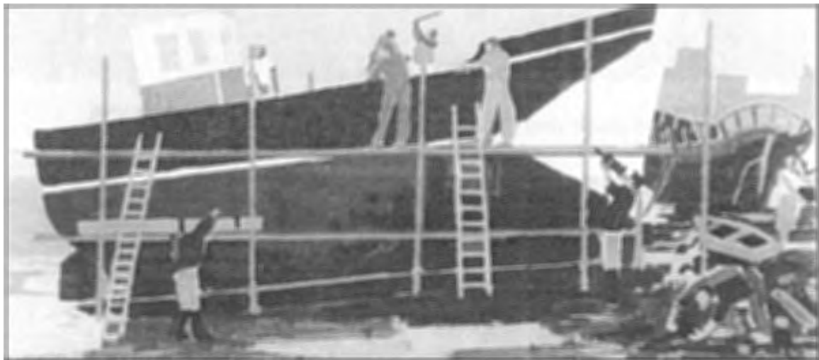
Le chantier, 1968, tekening.