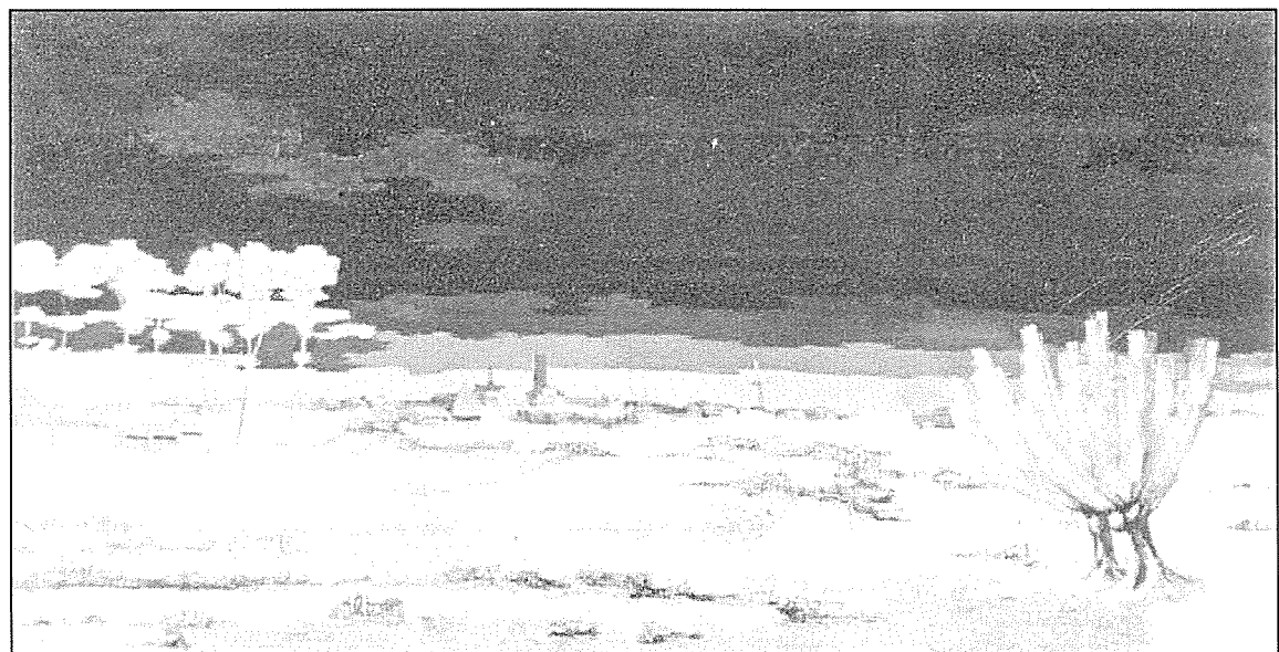
Damme, 1972, schilderij.