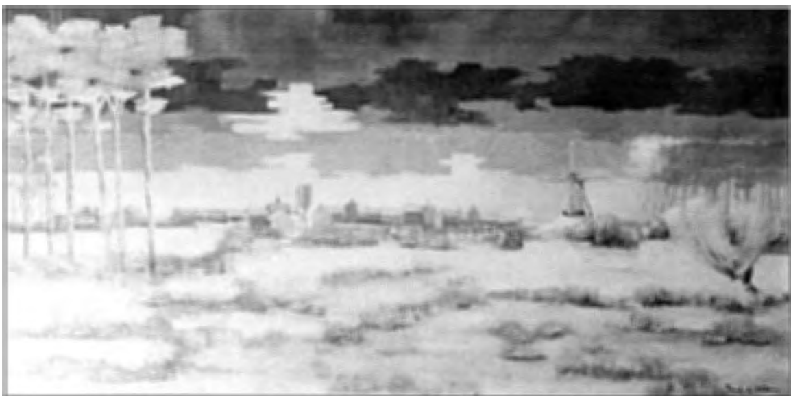
Paysage au moulin, olie op doek, 95 x 198