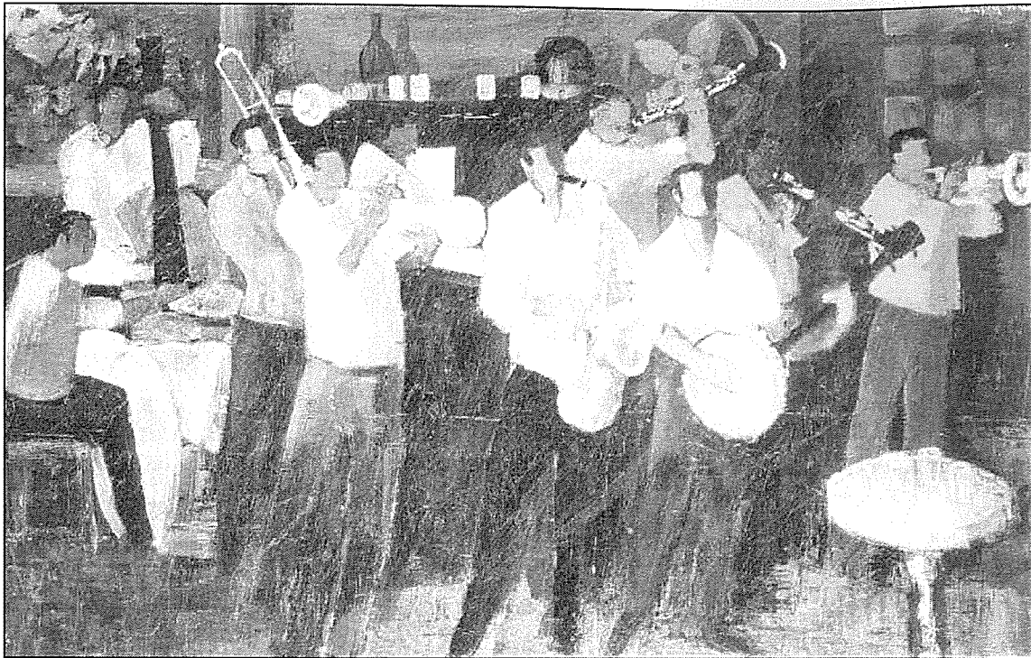
Count Basie and his band New-Orleans, 1985, schilderij