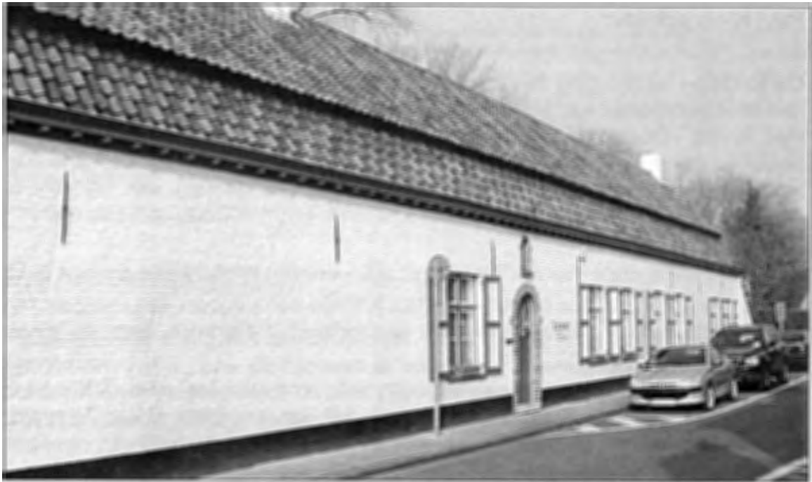
Villa Uilenkot, Sleestraat 20 Damme

Omstreeks 1961 verhuisde het gezin naar Villa Uilenkot in de Sleestraat 20 te Damme. Oorspronkelijk was het een kleine hoeve langs de Damse vaart, verdoken achter een afsluiting van riet en te midden van een groot hof. Paul Klein maakte er een woonhuis annex ateliers van.