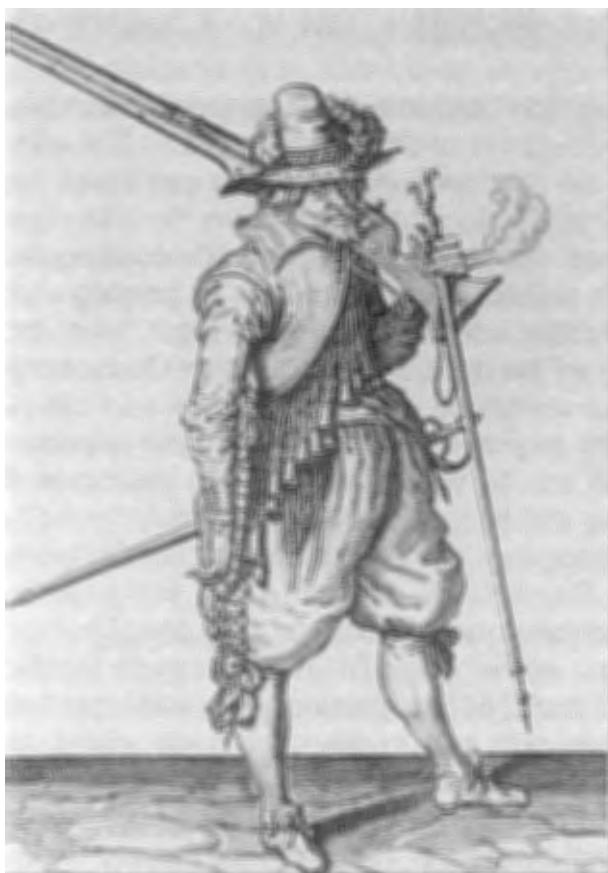
Een musketier uitgerust met een musket (Jacob de Gheyn, Wapenhandelinghe van roers, musquetten ende spiessen, 's Gravenhage, 1607)