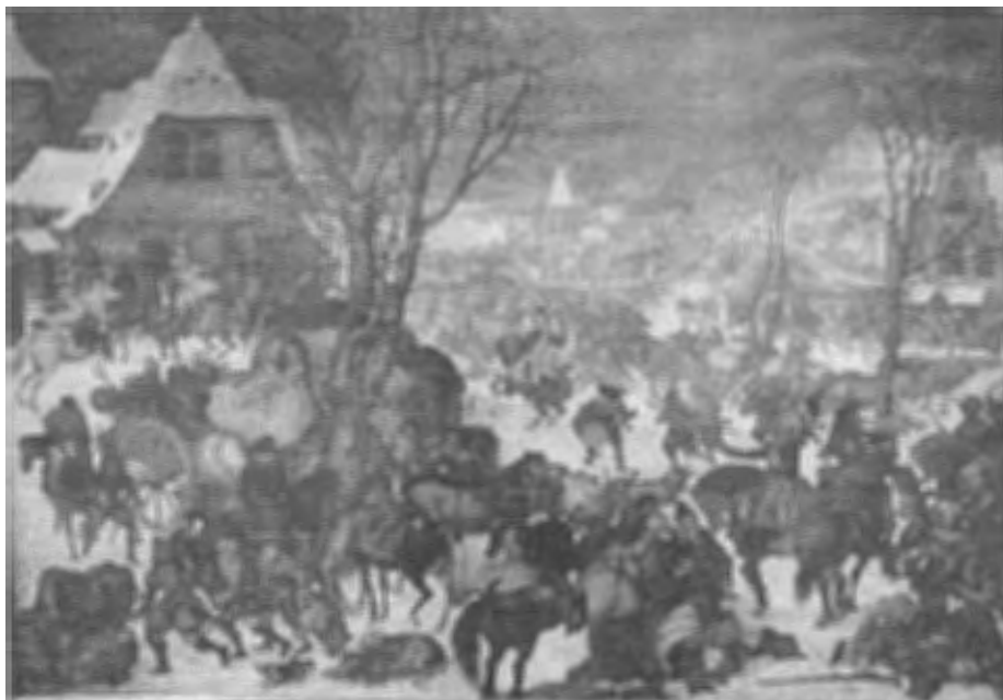
Plundering van een dorp, door Roeland Savery geschilderd in 1604 (° Kortrijk, 17 de eeuw)

In 1591 sloten het Brugse Vrije en de stad Brugge overeenkomsten met de vijand 66 opdat het platteland gevrijwaard zou blijven van brandschattingen en de scheepvaart via Sluis normaal kon verlopen maar we betwijfelen of dat alle vrijbuiters in toom heeft weten te houden.