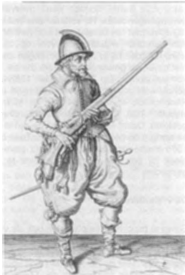
“Roerdrager” of soldaat gewapend met een roer of haakbus (Jacob de Gheyn, Wapenhandelinghe van roers, musquetten ende spiessen, 's Gravenhage, 1607)