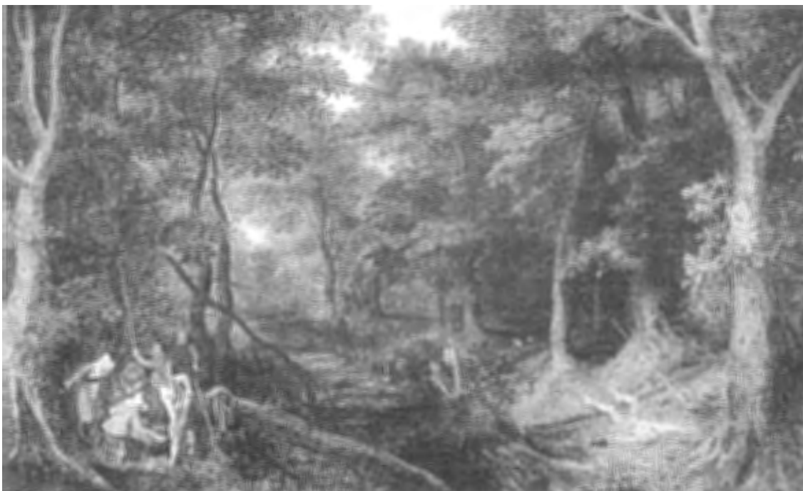
Overval in het bos, Jan Brueghel de Oude (ca. 1605)

Een bende van negen Engelsen, één Duitser en de Amsterdammer Heinric van Coevoorde van het garnizoen van Oostende waren in 1589 zonder veel planning uut ghecommen om buyt . Een vijandelijke legerbende onder leiding van een kolonel lieten ze ongemoeid omdat deze met teveel waren om aan te vallen. Onderweg stalen ze wel twee paarden en namen twee boeren gevangen. Uiteindelijk liepen ze in een bos zelf in een hinderlaag waar ze werden besprongen zodat zij verstroyt wierden . Ook de groep Oostendenaers waarvan Jooris Coppens deel uitmaakte, werd in Waasten verslegen ende verstroyt door een boerenmilitie of garnizoenssoldaten van Ieper toen ze langs een weg in een hinderlaag lagen. De 25-jarige Coppens kon weglopen maar viel in de buurt van Brugge in handen van Spaanse troepen. Hij werd er op 3 januari 1586 opgehangen. Zijn bende was eigenlijk uuijtghelopen om een rekening te vereffenen met een man die in Oostende een paard van hen had gestolen. Ze vonden hem niet en probeerden dan een andere aanslag te plegen die faliekant afliep. Strooptochten waren gevaarlijke ondernemingen. Heinric van Coevoorde nam deel aan drie strooptochten die slecht afliepen. Bij een overval op een konvooi van Rijsel werd hij gekwetst en gevangengenomen. Zijn bende liep eens in een bos in een hinderlaag en werd uiteengeslagen. Hijzelf en vijf kameraden vielen toen in handen van de vijand. Een andere keer werd zijn bende opnieuw geslagen maar hij kon wegvlugten. 30