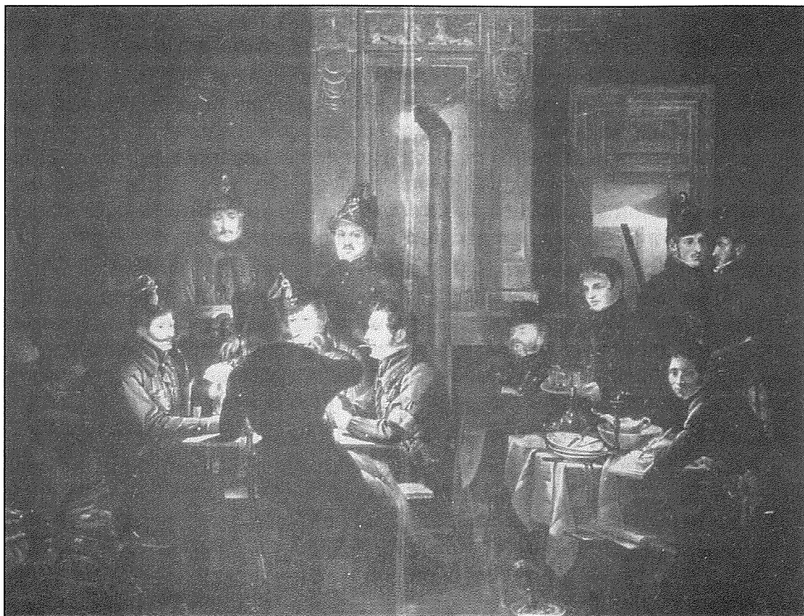
De Brugse "Garde Civique", geschilderd door Wulfaert, met een knipoog naar de nachtwacht van Rembrandt