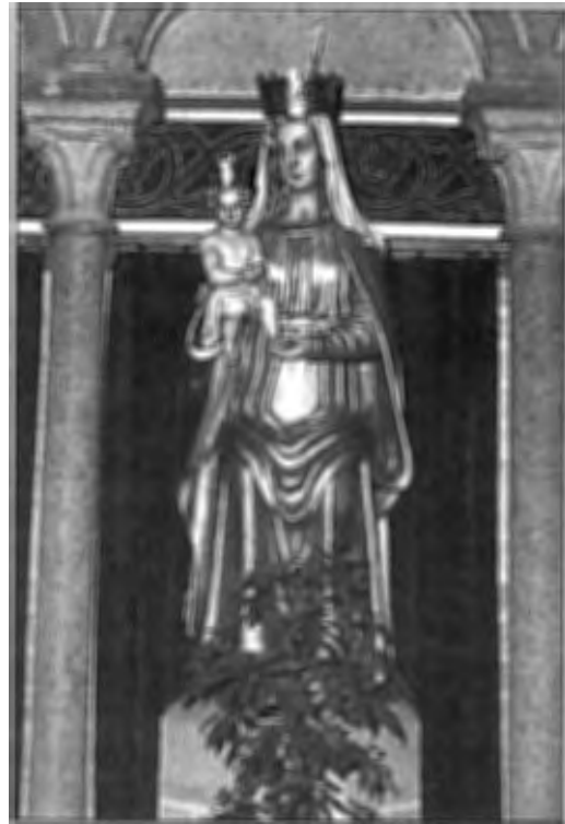
Het huidige Mariabeeld