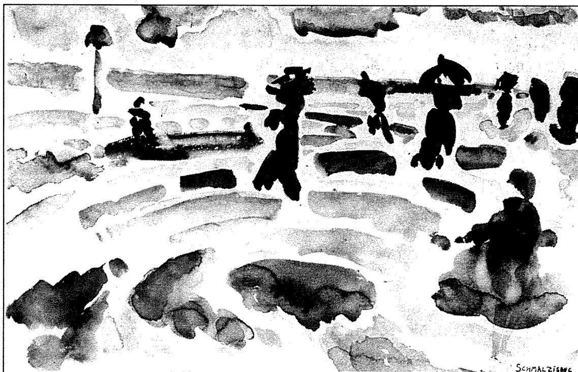
Strand met figuren, Scheveningen aquarel op papier, 1915

Hij was een authentiek schilder, een onvermoeid zoeker en vernieuwer, één van die zeldzame kunstenaars die een nieuw licht werpen op de oneindigheid van mogelijkheden; een van diegene die ons eens te meer en beter doen begrijpen dat in de schilderkunst het gebruik van formules absurd is." (Phil Mertens, 1984)