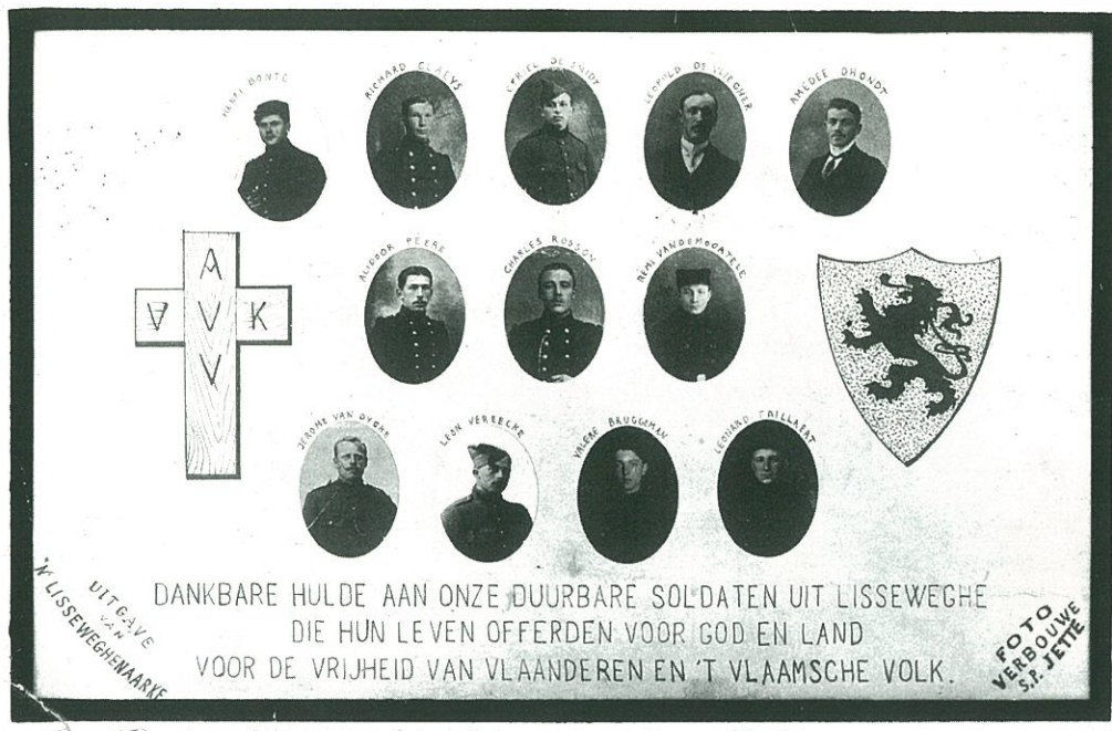
Gesneuvelde soldaten uit Lissewege