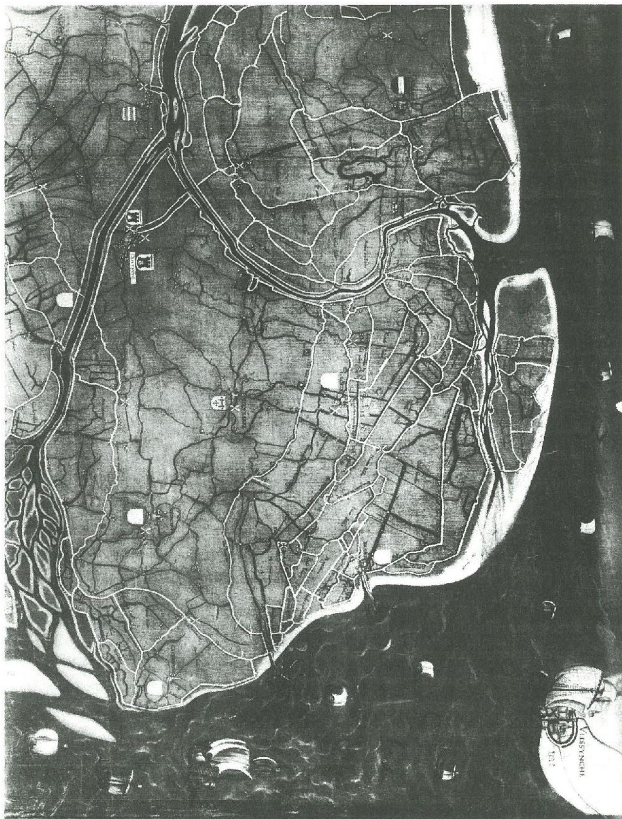
Fragment van de kaart van het Brugse Vrije, door Pieter Pourbus (1571): de noordoosthoek van het Brugse Vrije.