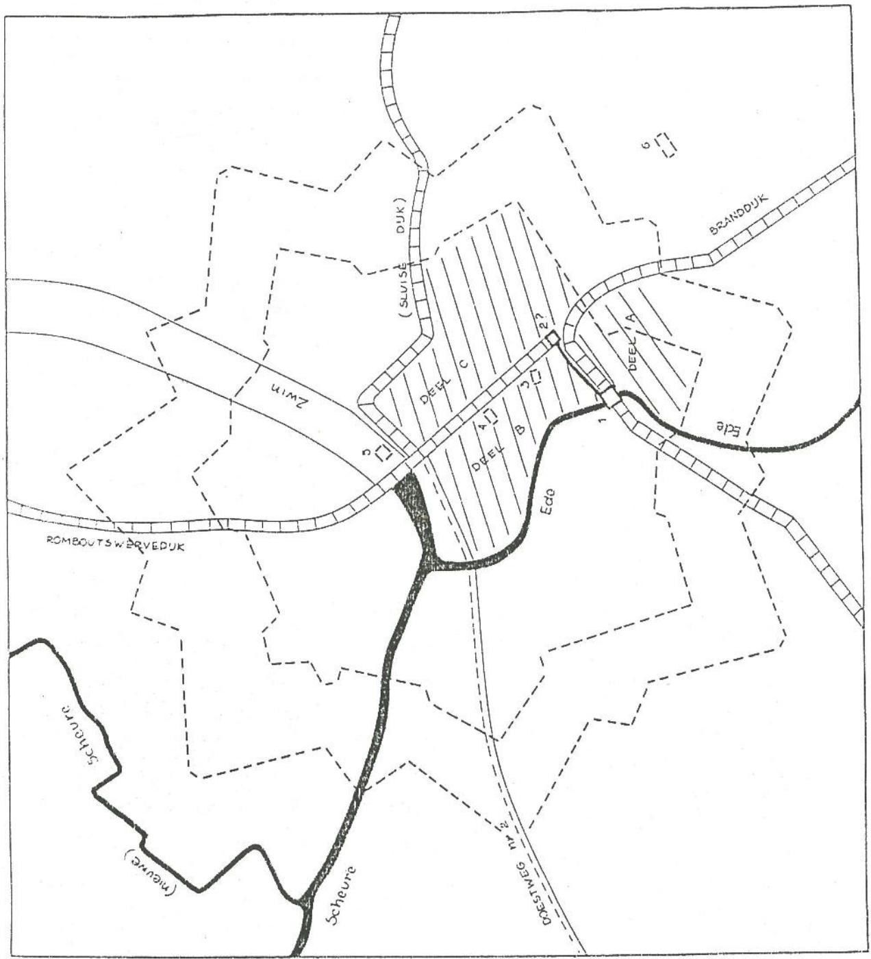
M. COORNAERT KAART 2 DE STAD DAMME ca. 1130 — = 50 m