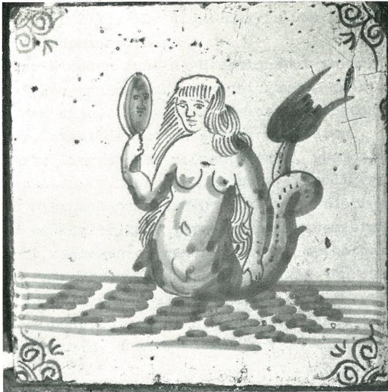
De meermin op een wandtegel.