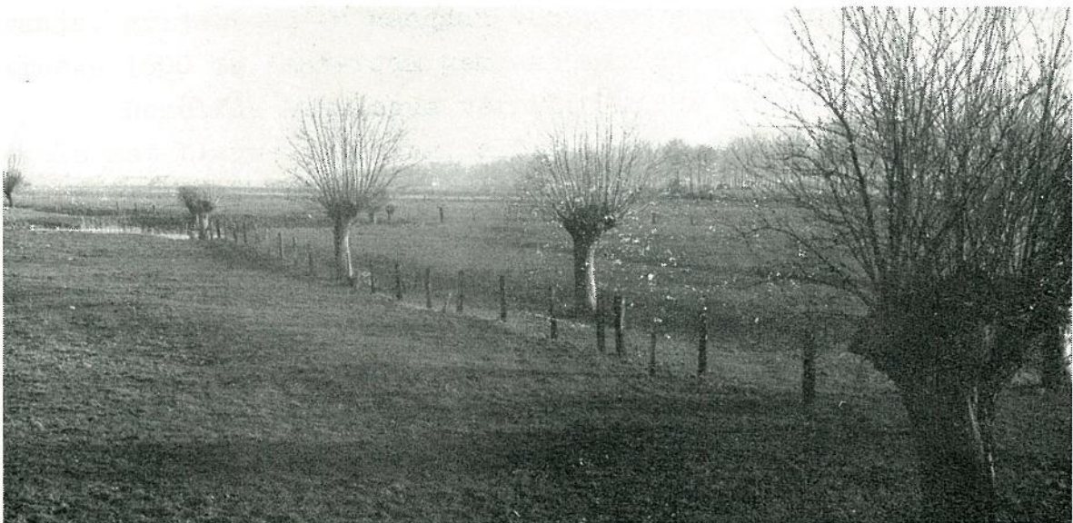
De Meerminneput te Oostkerke. Tussen de tronk op de voorgrond en de put, ziet men duidelijk de basis van de Dijk van de Kerkwatering.