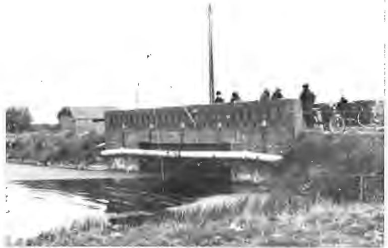
2. De Scharebrug met palingvissers