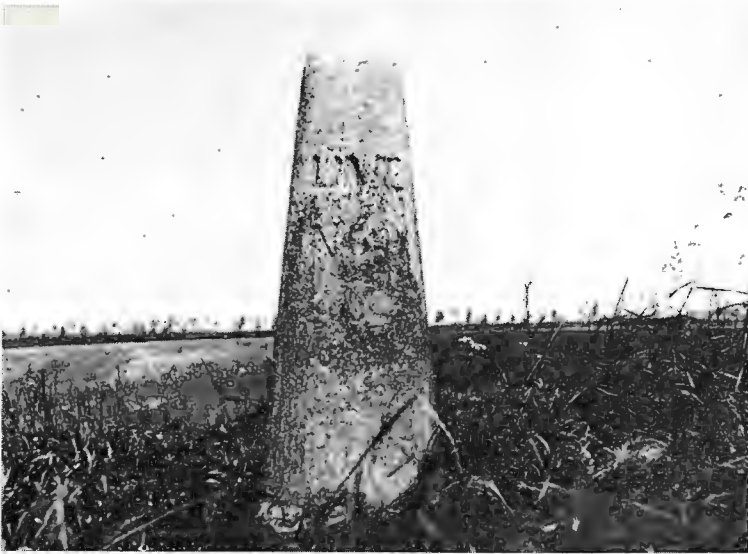
1. Liniepaal op Zuidzande