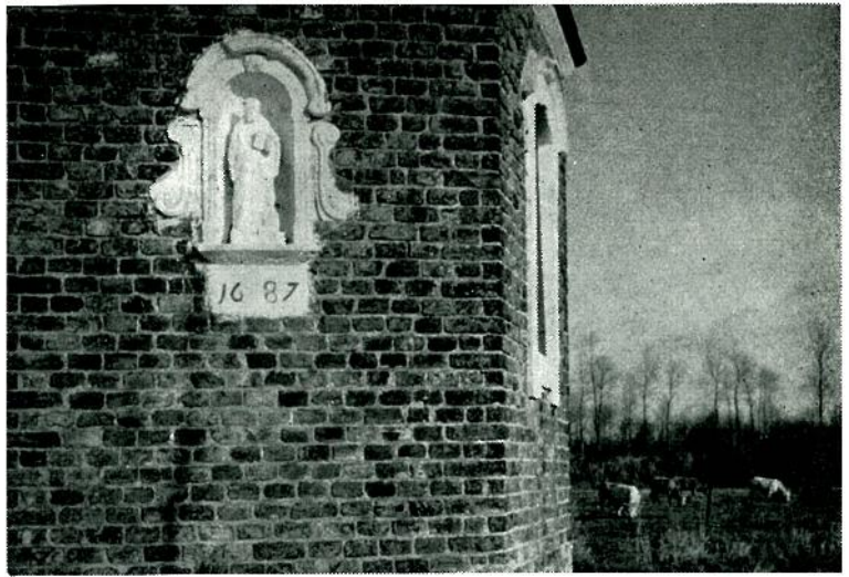
Kapel te Lissewege : Detail van achtergevel met St-Bernardusbeeld en jaartal.