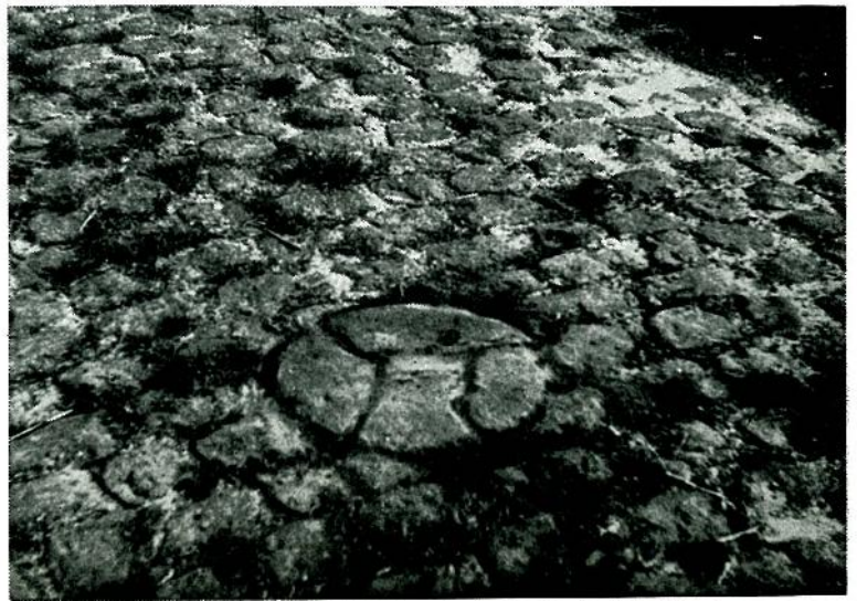
Het Driegemcentenpunt op Zoetendale (lees blz. 160)