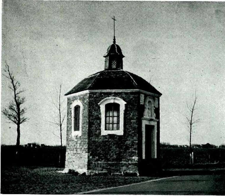
De Capelle van Onse Lieve Vrouwe by Doest