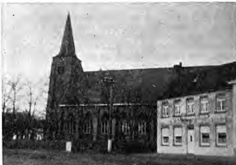
Ramskapelle nu. Vooraan rechts "De Gouden Leeuw" waar vroeger "Sinte Sebastiaen" stond.