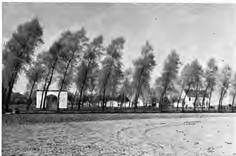
De Kasteelhoeve « De Rode Poort ».