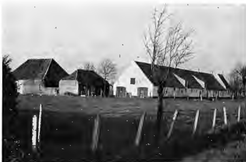
De grote hofstede « De Schaperie ».