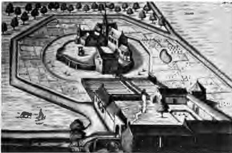
Het Schottekasteel in de 17 e eeuw, met opperhof en neerhof.