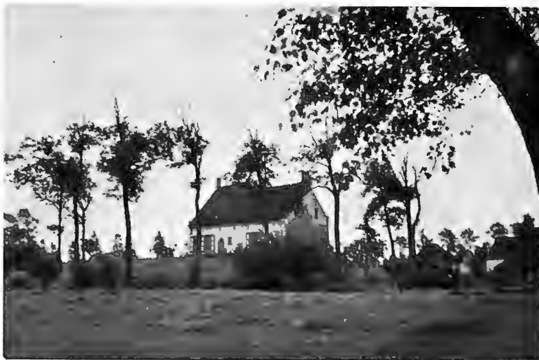
Het Kasteelken op een hoge wal met ringgracht.