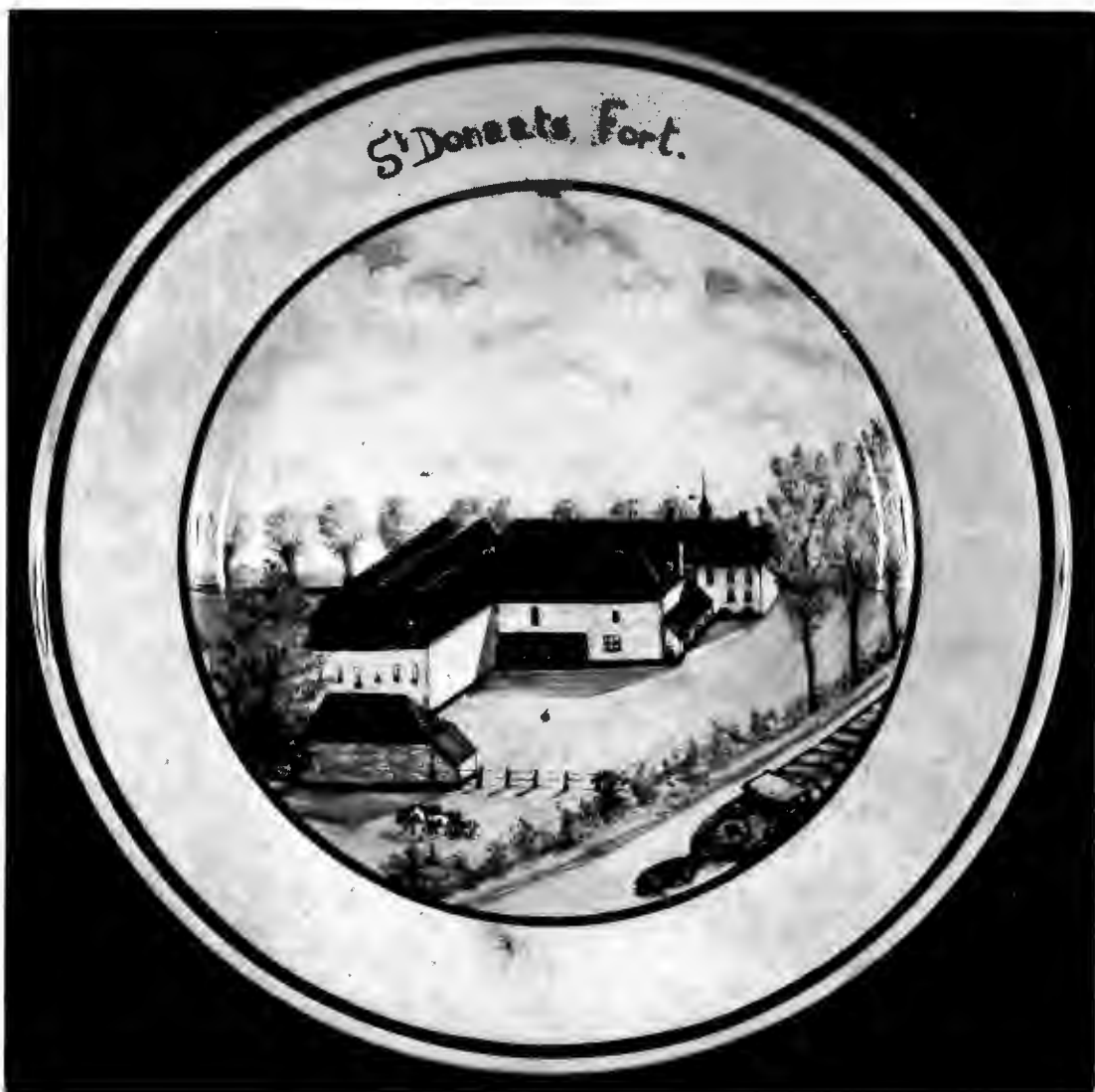
Lapscheure : de St.-Donaashoeve rond 1900 (Pronktelloor eigendom van Adiel Daeninck)