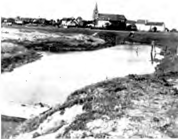
Ramskapelle : verbrede Noordwatergang bij de Brugse Steenovens. (nu verdwenen onder de nieuwe baan)