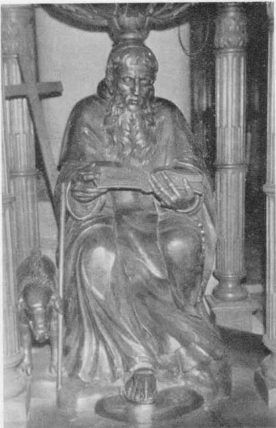
Sint Antonius " met zijn zwijntje .. onder de predikstoel te Heist. eikenhout door J. E. Reynaert 1786 ?