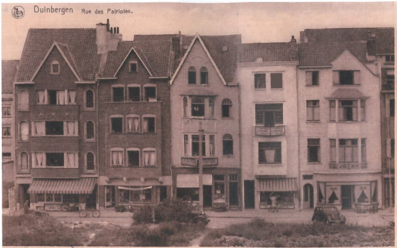
Van L nr R: Patriottenstraat met beenhouwer Annoot (later Roger), Vermeersch, Corthier, Bouckaert (later café Time Square) en Jalna (later St Tropez) en verder De Grootte.

Ondertussen zijn er in Duinbergen zeer veel handelszaken verdwenen. Diegenen die er zich vestigden hielden er vaak geen rekening mee dat Duinbergen slechts enkele maanden per jaar echt leefde. De winters waren kalm en dood.