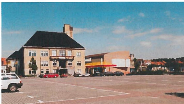
Het huidige stadhuis architecturaal verminkt door aanbouw zaal Ravelingen