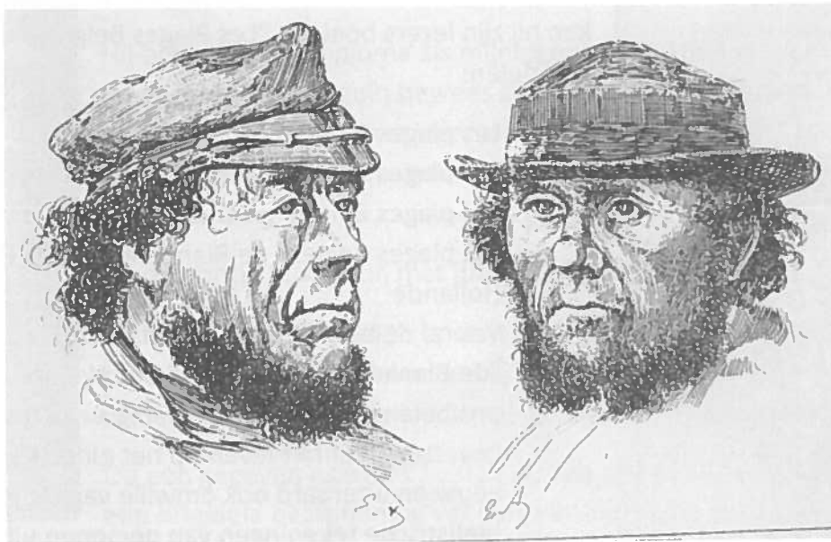
Oude Heistse vissers

Hij wijst ook op het tweeledige Heist: het stuk ten Noorden van de Graaf Jansdijk (de Koninklijke baan of Elizabetlaan nu) dat toeristisch is met de zee en de duinen en het vriendelijke vissersdorp ten Zuiden waar men nog in contact kan komen met de echte vissers.