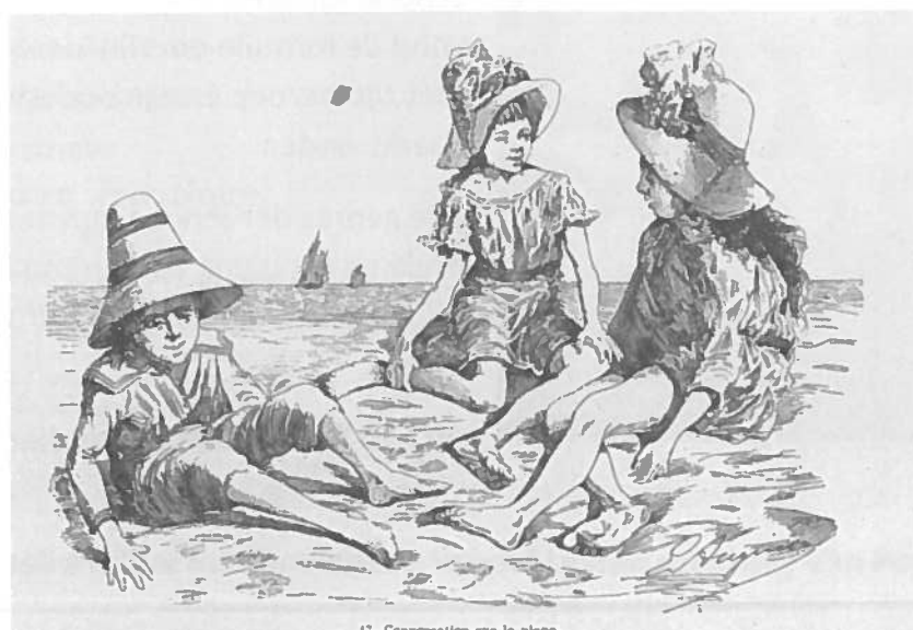
17. Conversation sur la plage.

Zijn aandacht gaat tenslotte ook naar de toeristen en de kinderen: hoe ze zich vermaken, hoe ze in zee garnaaltjes vissen, zandkastelen bouwen of gewoon spelen in het zand.