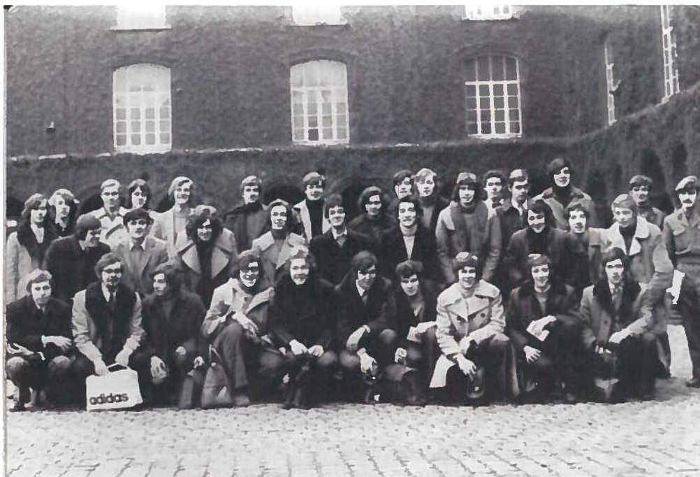
De traditionele foto (met enkele Heistenaars) voor het klein kasteeltje in Brussel.

dan de eigenlijke legerdienst. Sinds de Tweede Wereldoorlog had men de keuze tussen een legerdienst in België of een legerdienst in Duitsland (die niet zo lang duurde).