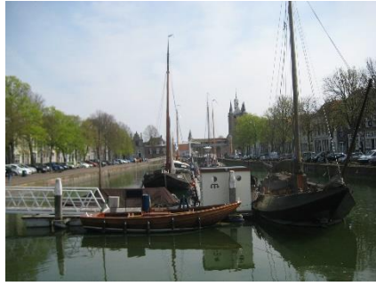
Het schilderachtige vissershaventje in Zierikzee