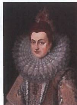
Isabella van Spanje

ISABELLA VAN SPANJE ( 1566 -1633) was landvoogdes tijdens de Spaanse bezetting.