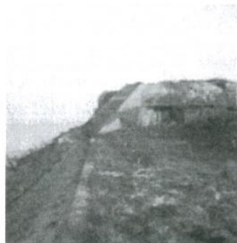
De Tobrouck-batterij

Elke dag moesten we om half acht aan het station zijn voor de vracht (grint, cement, Rijnzand) die moest geladen worden. Dit materiaal diende voor het bouwen van een brug langs de internationale dijk aan het Zwin.