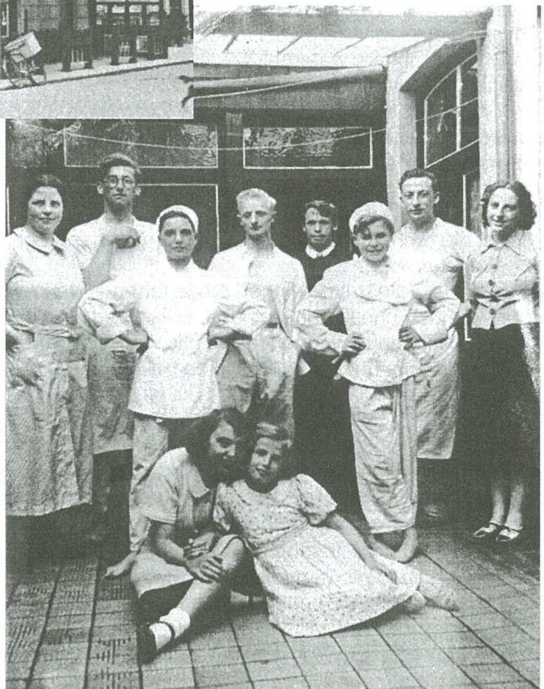
Patisserie "Edelweis" geopend in 1946, na zware vernielingen ingevolge de brand in het Kursaal.