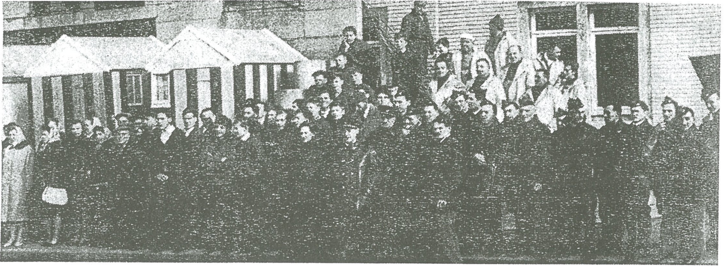
Brandweermannen, strandredders, leerlingen van de visserij scholen en andere medewerkers, tijdens de namiddagherhaling.

Dank zij medewerking van het gehele Vlaamse land