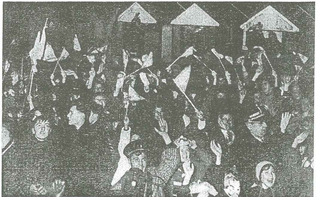
Men bemerkt hierboven duidelijk de grote geestdrift die, na de bekendmaking van Heists overwinning op de wachtende menigte oversloeg. Er werd gezwaaid met vlagjes, scheepslantaarns en alles wat in handen kreeg.