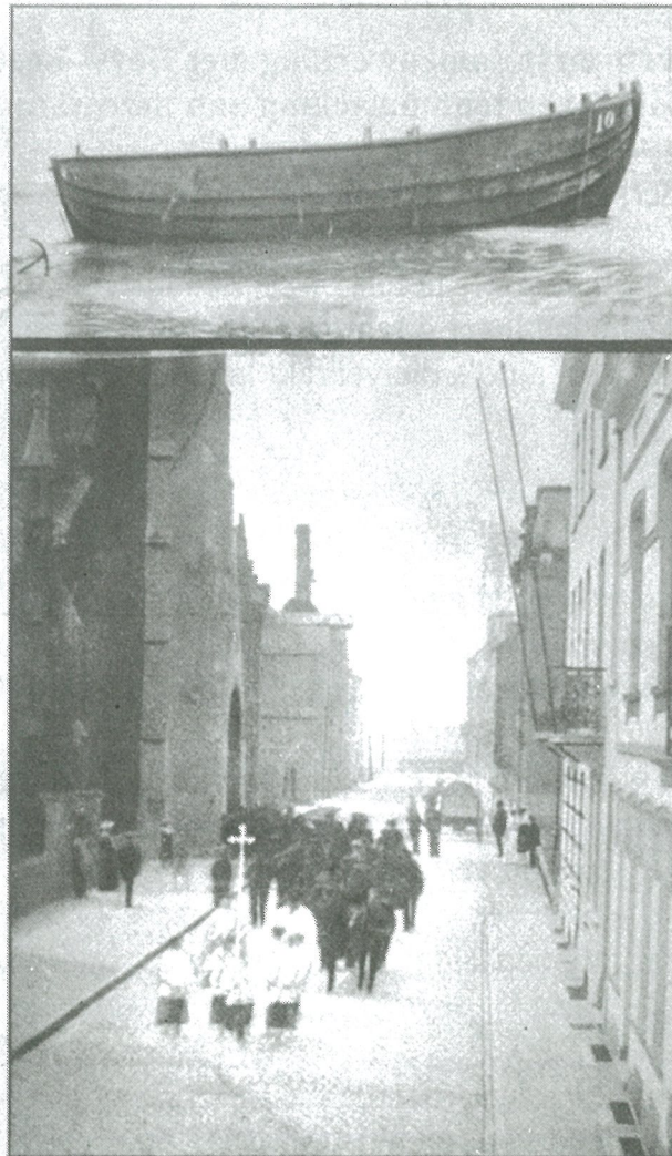
L'enterrement des 4 victimes du naufrage de Heyst, le 29 juin 1906. — La chaloupe échouée sur le rivage. De begrafenis en de sloep van de 4 verdronken ongelukkige visschers, te Heyst, den 29 Juni 1906. Pauwels, rue du Damier, 8, Bruxelles. - Déposé.