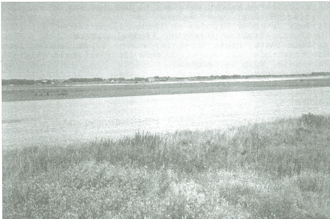
We kijken naar het oosten richting Westkapelle