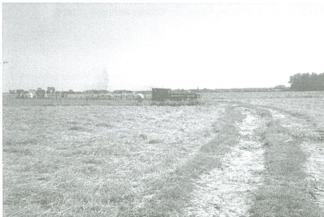
We staan in Oostwinkel (Breed Veertien) en kijken richting Ramskapelle