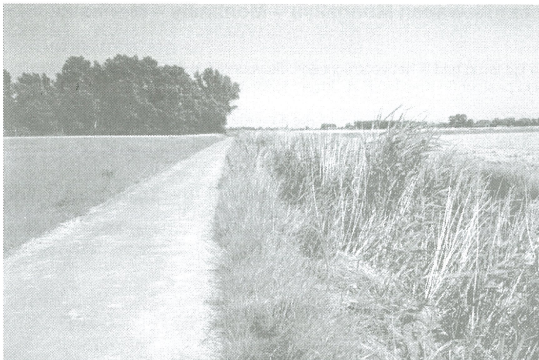
Op de grens van de Isabellavaart - wij kijken naar het noorden - wij bevinden ons op de zuidelijke begrenzing van het project