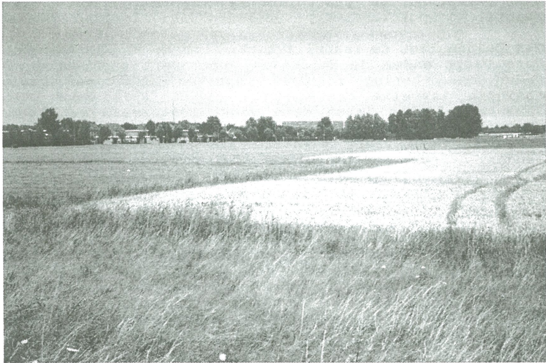
Foto achtergrond Laguna Beach en wijk Oostwinkel We kijken naar het noordoosten