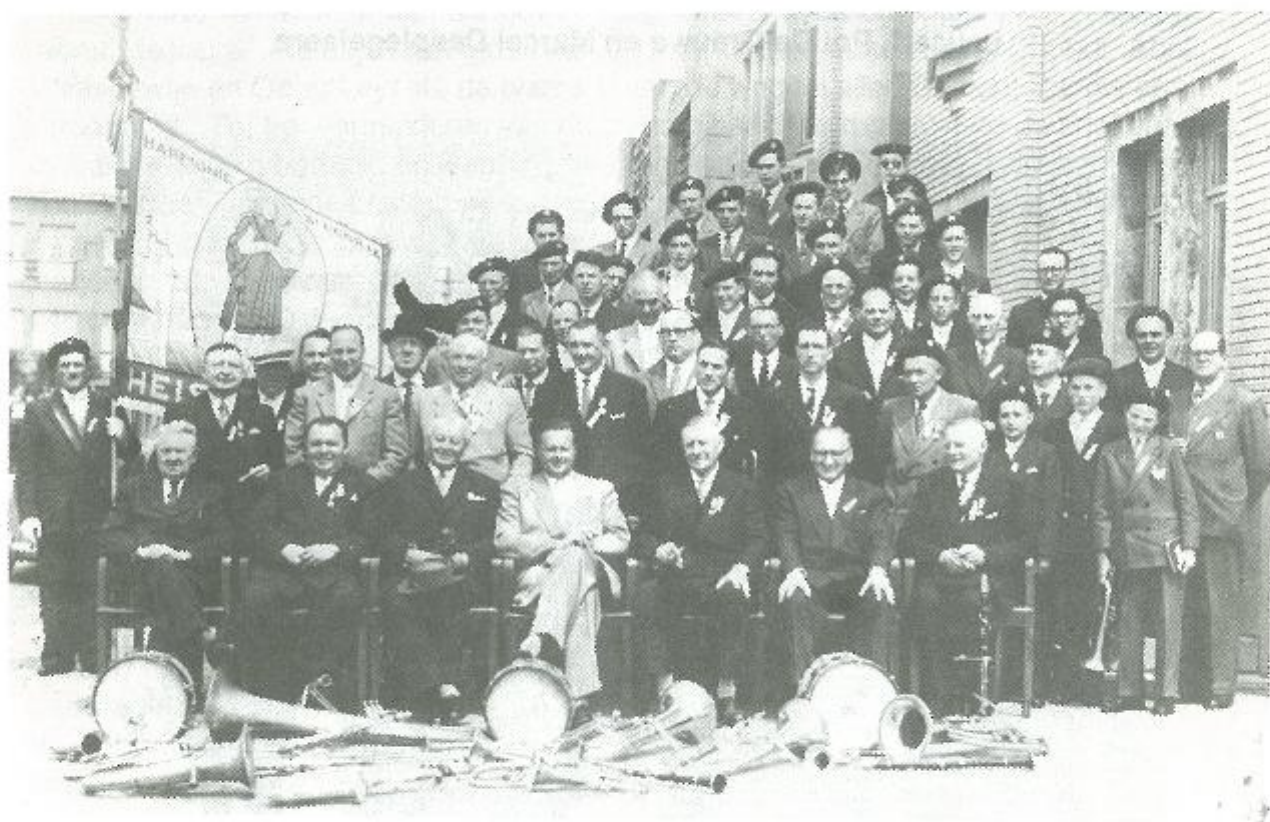
Viering gouden bestandsjubileum 1908 – 1958