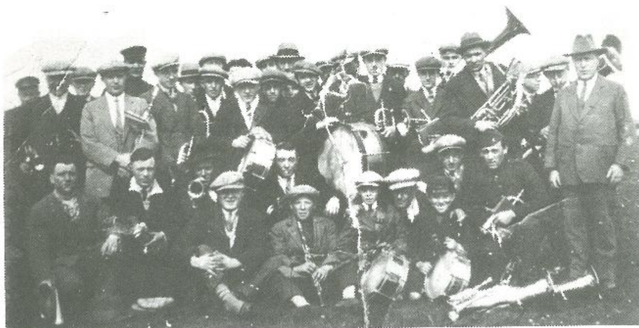
Willen is Kunnen 1928