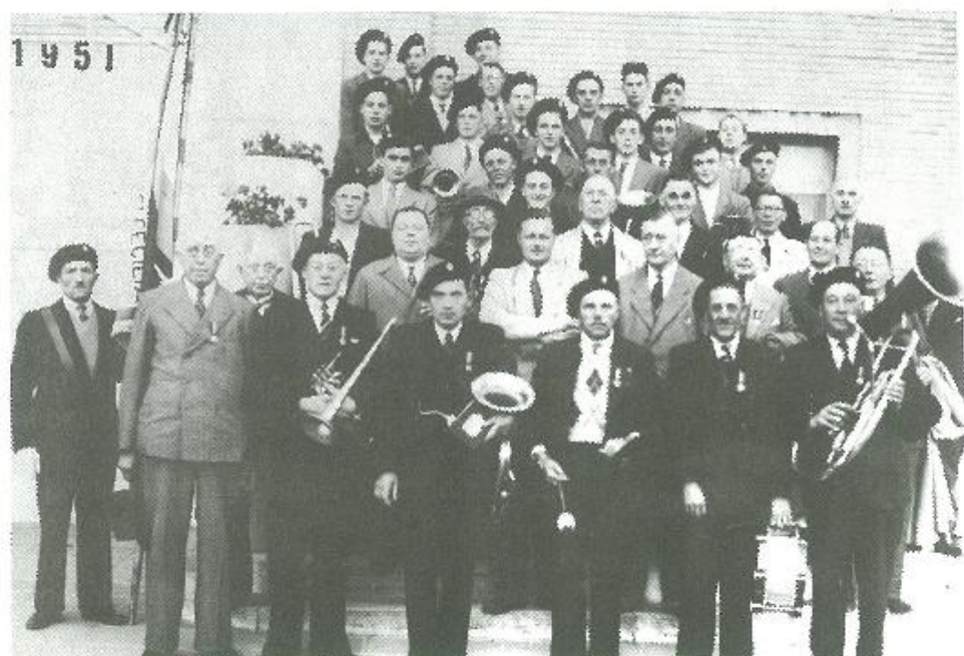
De fanfare in 1951