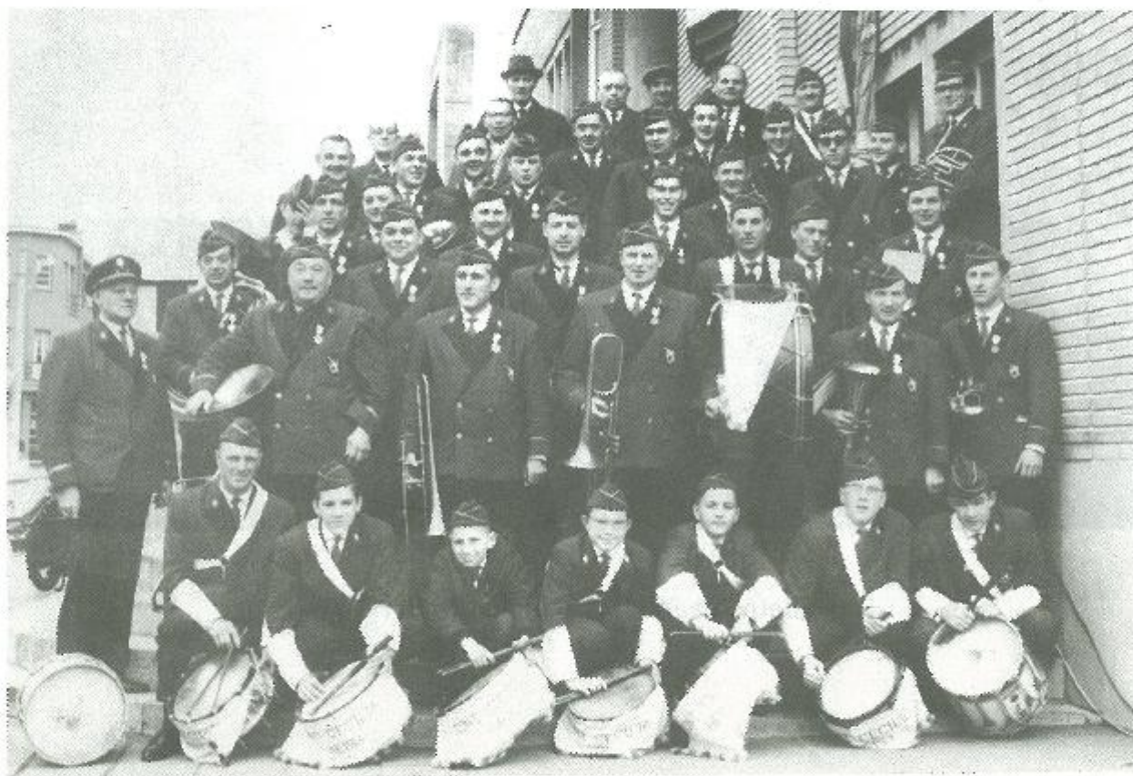
Sint-Cecilia op het pui van het Helstse stadhuis 1963

Op 16 februari 1969 wordt het 60-jarig bestaan van de harmonie gevierd en kregen de muzikanten en bestuursleden hun tweede nieuwe uniform, deze maal van donkerblauwe kleur.