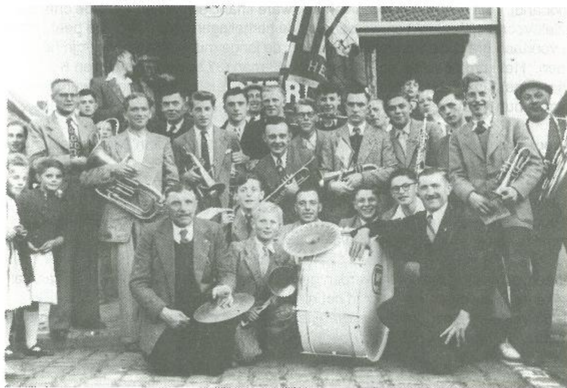
De harmonie in 1947

De eerste uitstap onder beleid van dat vernieuwd bestuur had plaats op Paasdag, gevolgd door talrijke andere prestaties ondermeer in Lissewege, Dudzele, Sluis, Aalter, Merchtem, Westkapelle, Ramspkapelle, Knokke, Wenduine, Oostende, Schaarbeek, Brugge, Compiègne (F), Eeklo, Namen... en uiteraard in Heist zelf.