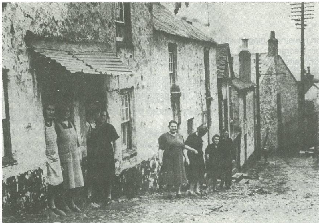
De krotwoningen waarin veel van onze Belgische vissers moesten verblijven te Newlyn – Penzance