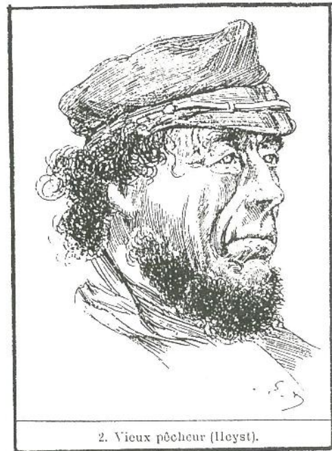
2. Vieux pêcheur (Heyst).

die er zich toe verbond voor 1988 de organisatie daadwerkelijk te steunen en Heyst Leeft kreeg er de moed weer in. Alleen is het zeer moeilijk, maar met de inzet van het bestuur, de steun van de overheid en de plaatselijke middenstand wordt alles mogelijk. Jammer dat alle begin zo moeilijk is en dat zo weinig mensen er van bij het begin willen in geloven. Vandaar wellicht de bijna absolute afwezigheid van het Gemeentebestuur van Knokke-Heist?