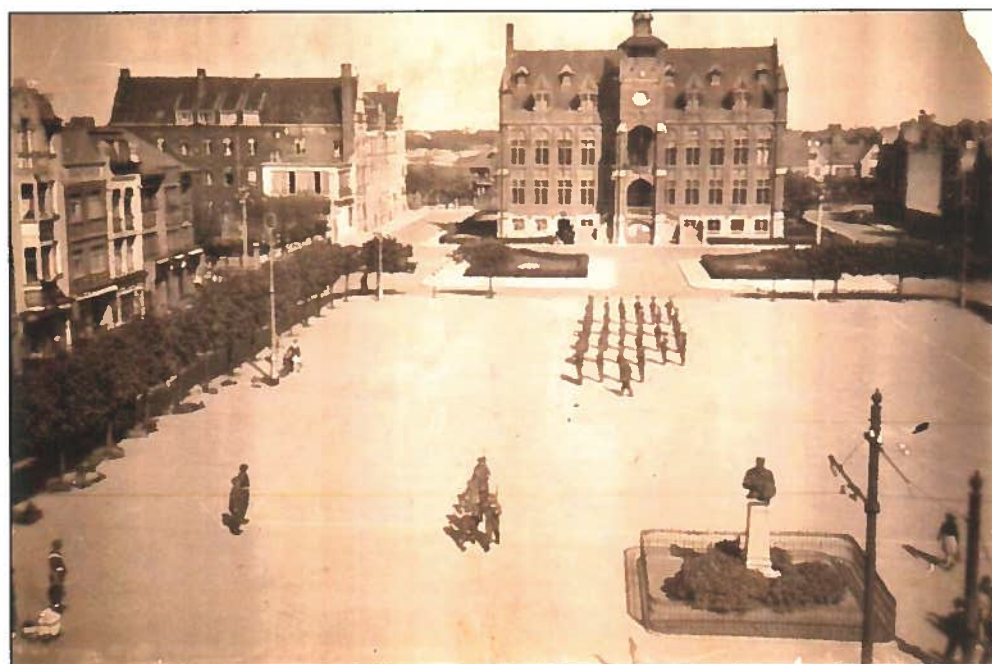
1945: Engelse militairen oefenen voor een parade op het Verweeplein.