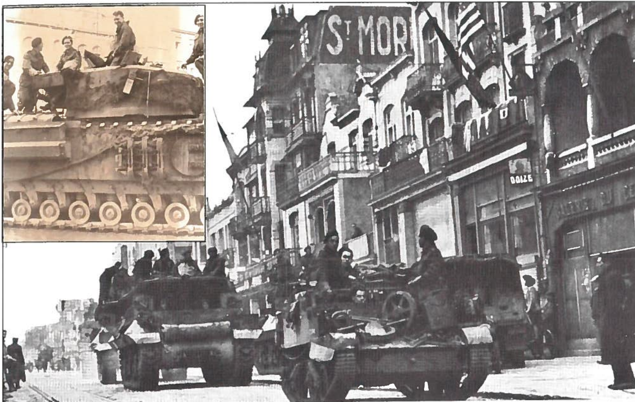
Knokke 1 november 1944: Een brenccarrier en 'Achilles-tanks' in de Lippenslaan.