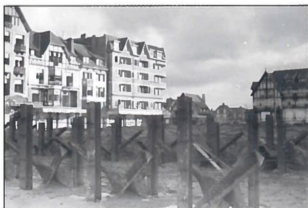
Versperringen op de dijk ter hoogte van het Albertplein.