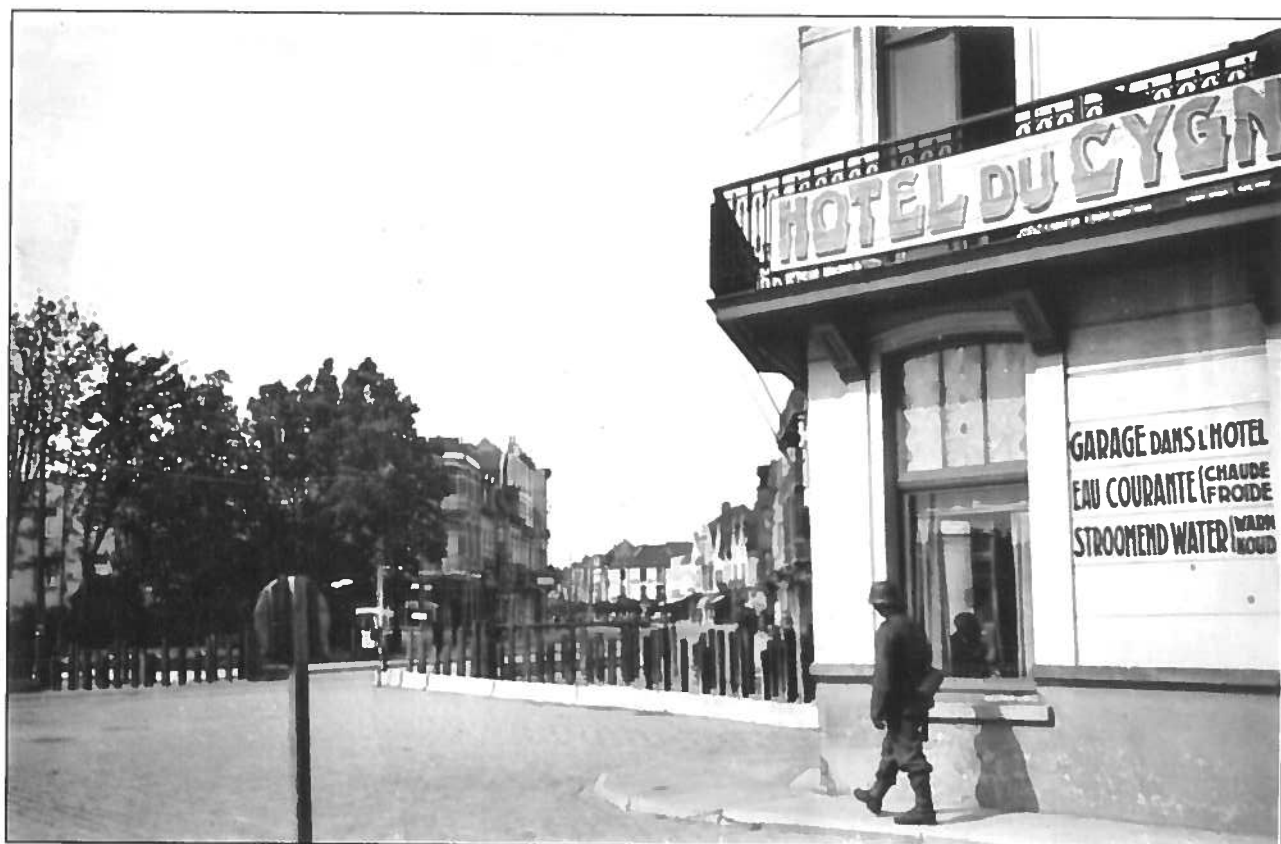
Onder: Een Duitse soldaat stapte voorbij 'Hôtel du Cygne' bij de Smedenstraat.