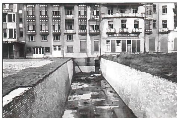
Een antitankgracht op het Albertplein.