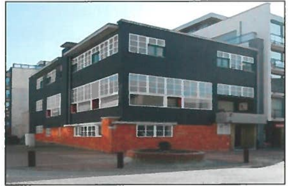
Afb.14. Het Zwarte Huis.

De meubels werden ontworpen door Huib Hoste: bureaumeubel, boekenrek, zetel en vooral het kleine theetafeltje met de prachtige knoopverbindingen. Het was bedekt met glas. 18 De kleuren werden gekozen door Servranckx. De wanden waren niet beschilderd maar voorzien van gestreept behangpapier. 19 De vloeren waren niet in een Hoste-patroon gelegd. Bijzonder was het theetafeltje, gemaakt door meubelmaker Hoste en beschilderd in het zwart door Servranckx. Karakteristiek voor Hoste zijn de prachtige knooppunten. 20