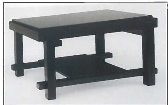
Afb.13. H. Hoste en Servranckx : zwart theetafeltje, © P. B. Mattelaer.