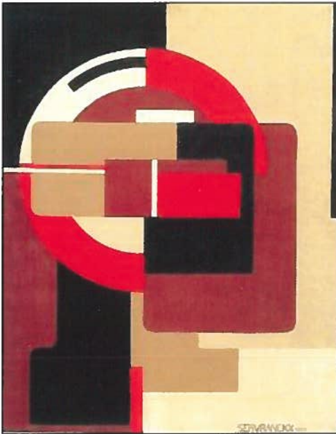
Afb.12. V. Servranckx, opus 9, 1922, 'Rode rotatieve' ©, Paris, Centre Pompidou.