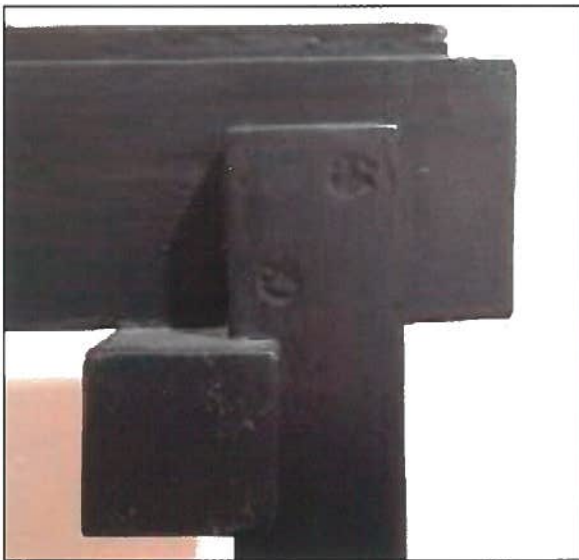
Afb.15. Knooppunt van het zwarte theetafeltje.

De meubels werden ontworpen door Huib Hoste: bureaumeubel, boekenrek, zetel en vooral het kleine theetafeltje met de prachtige knoopverbindingen. Het was bedekt met glas. 18 De kleuren werden gekozen door Servranckx. De wanden waren niet beschilderd maar voorzien van gestreept behangpapier. 19 De vloeren waren niet in een Hoste-patroon gelegd. Bijzonder was het theetafeltje, gemaakt door meubelmaker Hoste en beschilderd in het zwart door Servranckx. Karakteristiek voor Hoste zijn de prachtige knooppunten. 20