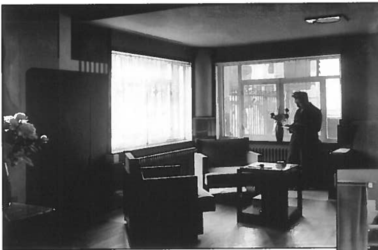
Afb.15 en 16, het Bureau-fumoir te Parijs (1925), © Fonds Huib Hoste, Sint-Lukasarchief - Stichting CIVA Brussels.