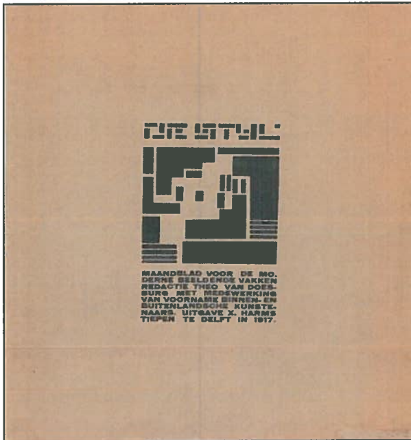
Afb.2. Kaft van het eerste nummer van 'De Stijl', © Fonds Huib Hoste, Sint-Lukasarchief - Stichting CIVA Brussel.

prachtig vond. Hoste benadrukte tevens dat hij het manifest van 'De Stijl' niet had ondertekend omwille van het antigodsdienstig karakter. De breuk tussen Van Doesburg en Hoste was totaal en Hoste mocht niet meer publiceren in 'De Stijl'. Katholicisme versus calvinisme. Hoste bleef echter trouw aan de doelstellingen van de beweging: verwerping van de klassieke Beeldende kunsten en architectuur Orthogonale architectuur (Nieuwe zakelijkheid), al dan niet gekleurd en bij voorkeur gebouwd in beton. Een plat dak wordt de regel. De interieurs worden 'environmenten': muren, kasten, vloeren en meubelen worden