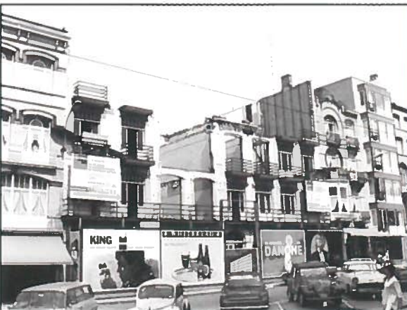
De sloop van het complex in 1966.