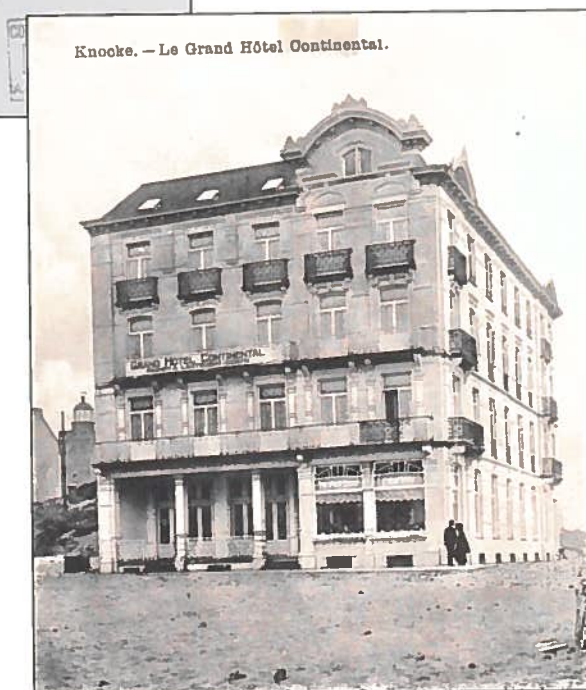
Het oorspronkelijk hoekgebouw omstreeks 1908.