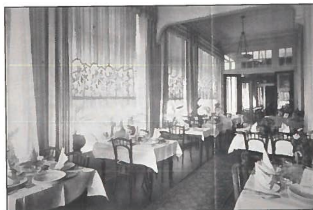
De eetzaal met zicht op het Van Bunneplein.