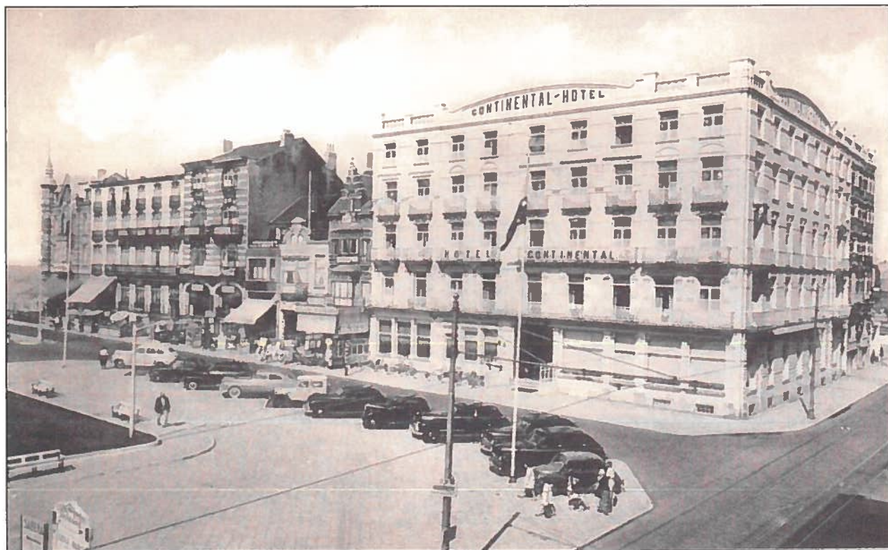
Het Continental Hotel met doorlopend fronton in de vroege jaren '50.