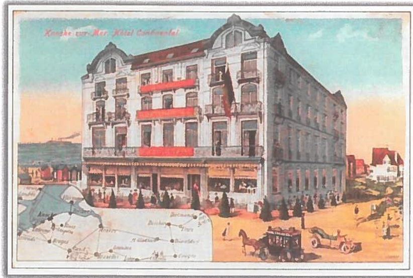
Postkaart met een tekening van de Duitse kunstenaar Erich Wessel

In de gids 'Le Littoral' van Bontenis-Berleur stond geschreven: 'C'est vraiment ici, à Knocke, que l'on retrouve le Blankenberghe des anciens jours.....jusqu' à ?' Toen vreesde men voor het te snel opkomende toerisme en de vermindering van de duinen. De Belle-Epoque was echter bepalend voor de ontwikkeling van Knokke als badplaats. Voor de meer en meer toestromende verblijvers had men accommodatie nodig. Het hotelbestand had een constante groei tussen 1900 en WO II.