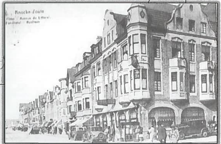
MIDLAND HOTEL 1924/1945 Kustlaan – Strandstraat Joseph Van Seghbroeck -De Cuyper

CONFORT MODERNE – LIFT EAU COURANTE – CHAUFFAGE