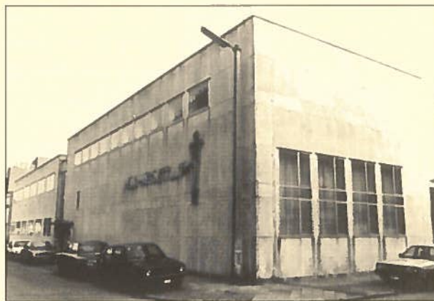
De gerenoveerde school in 1965 (architect Ta Chielens).

Nu zijn er plannen om ook dit gebouw af te breken en te vervangen door woongelegenheden in een eerder Modernistische stijl.