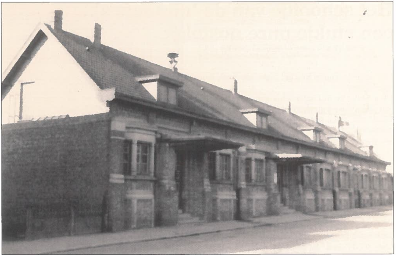
De school kort voor de veranderingswerken van 1964.