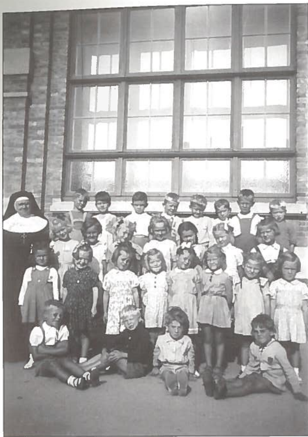
De 3de kleuterklas van 1949.

die we moesten uitduwen, laten groeien of heftig bewegen in de stormwind naargelang het in de tekst voorkwam, die luidop gedeclameerd werd. De jute stonk en de ruwe stof prikkelde mijn blote armen en gezicht. Ik kreeg overal jeuk. Op het eind kwam er nog een regenbui over ons, wij werden helemaal nat, een namaakkoe at van onze bladeren en dan, tot overmaat van ramp, kwam de boer onze takken ook nog afknippen. Dank u Adama van Scheltema, ik zal u nooit vergeten!