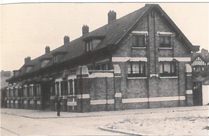
De Heilig Hartschool gezien van noord naar zuid.

Gedurende de oorlog werd de school door vier of vijf granaten getroffen en moest hersteld worden.