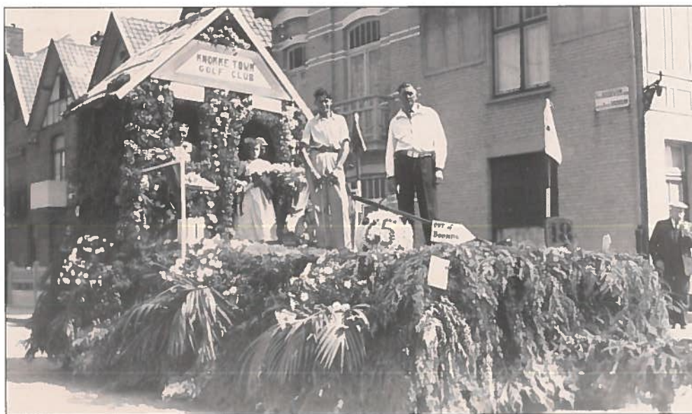
Een praalwagen van 'Knocke Town Golf Club' in de jaren '30 op de hoek van de Boudewijnlaan. De straatnaamborden waren nog tweetalig! Knocke is met dubbele K geschilderd!