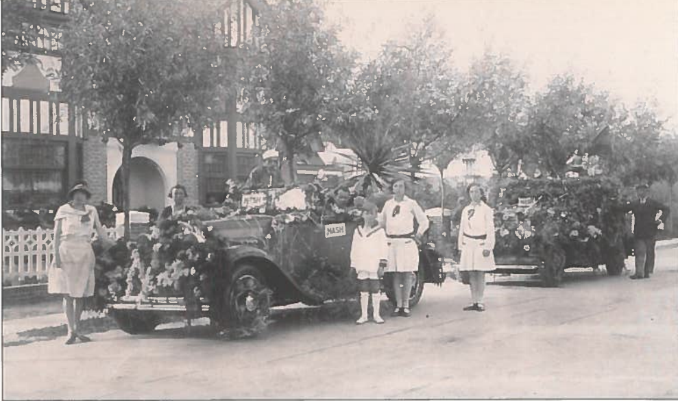
Naast de individuele deelnemers en praalwagens waren ook de 'old timers' van de partij. Villabewoners uit de Fochlaan poseren bij hun versierde wagen op zondag 18 augustus 1929.