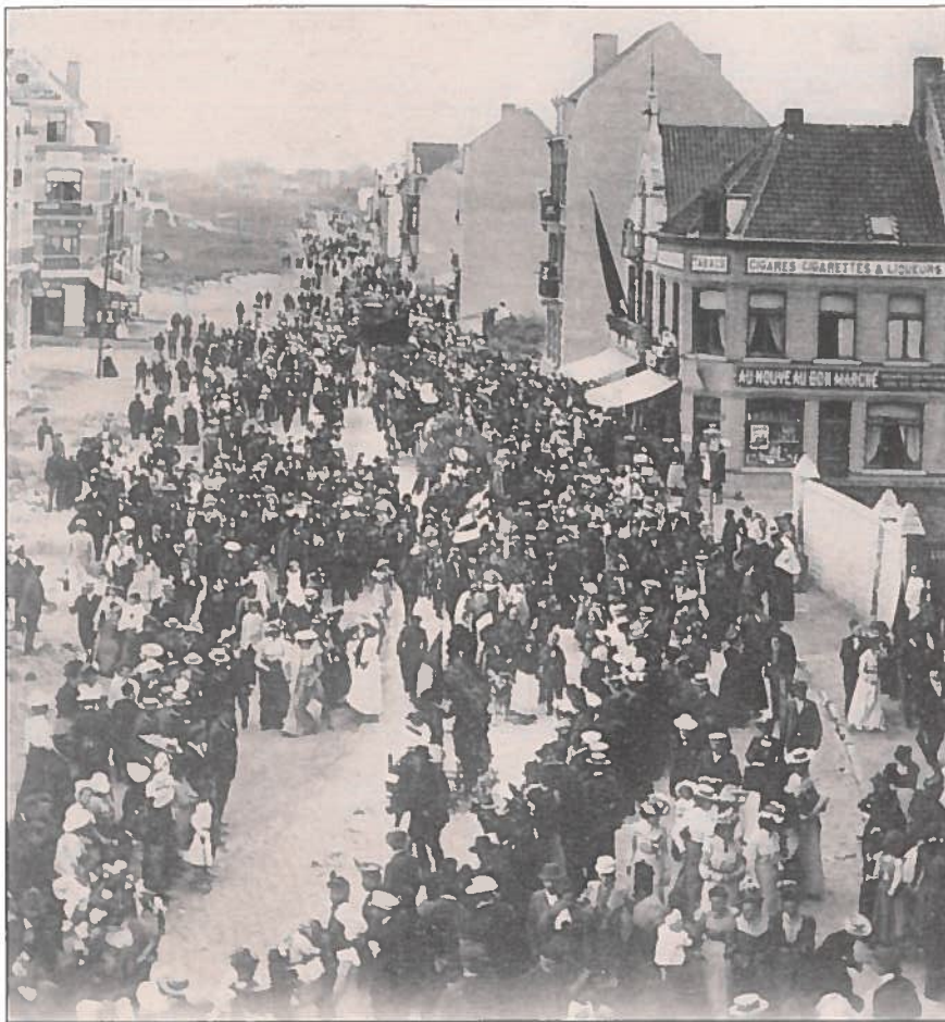
De corso van 1904 ter hoogte van de 'Place Publique'. Links 'Hôtel des Dunes'; rechts op de hoek het winkelletje van Pietje Jacobs.