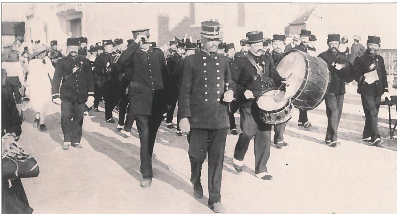
Een harmonie uit Noord-Frankrijk is op bezoek in Knokke en wordt begeleid door de plaatselijke 'garde' op de zeedijk ter hoogte van het 'Grand Hotel du Zoute' (1912).

Traditiegetrouw werd aan de Oostkust het seizoen afgesloten met een 'bloemenstoet'. In het voormalige Heist was dit evenement ontstaan in de laatste jaren van de 19de eeuw. In Blankenberge daarentegen is de corso, gestart in 1895, nog steeds in voege en lokt eind augustus ieder jaar een massa volk. Zowel verblijvers als eendagstoeristen komen naar de badstad om er de bloemenpracht te bewonderen.