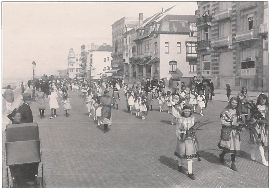
Een processie op de Zeedijk in de vroege jaren '20. We zien de mooie 'belle epoque' gevels van toen.