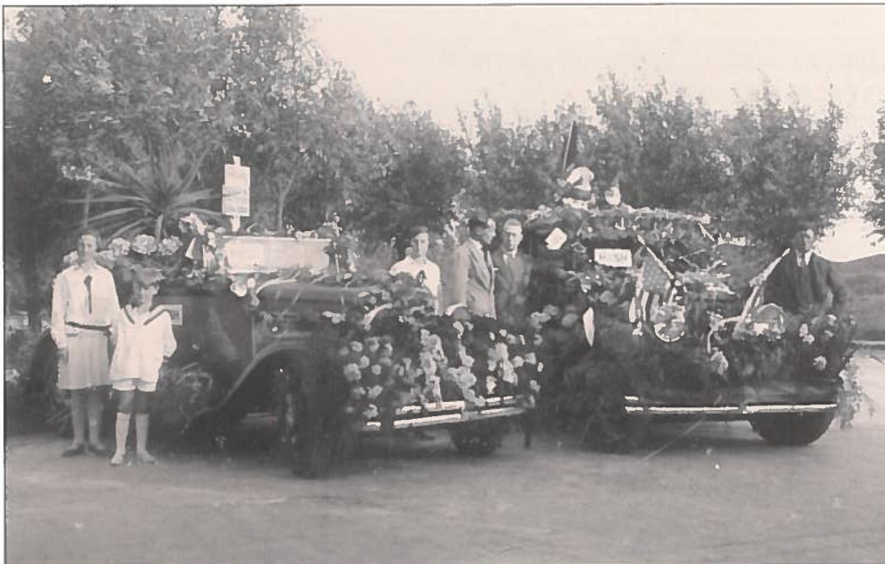
Klaar voor de bloemenstoet van 1929.