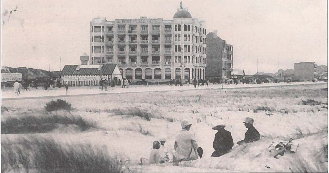
Het 'Albert Plage Hotel' kwam er voordat het Casino in 1930 werd opgericht. In een houten barak kon men toen de plannen gaan bekijken van het nieuwe casino van architect Stynen.