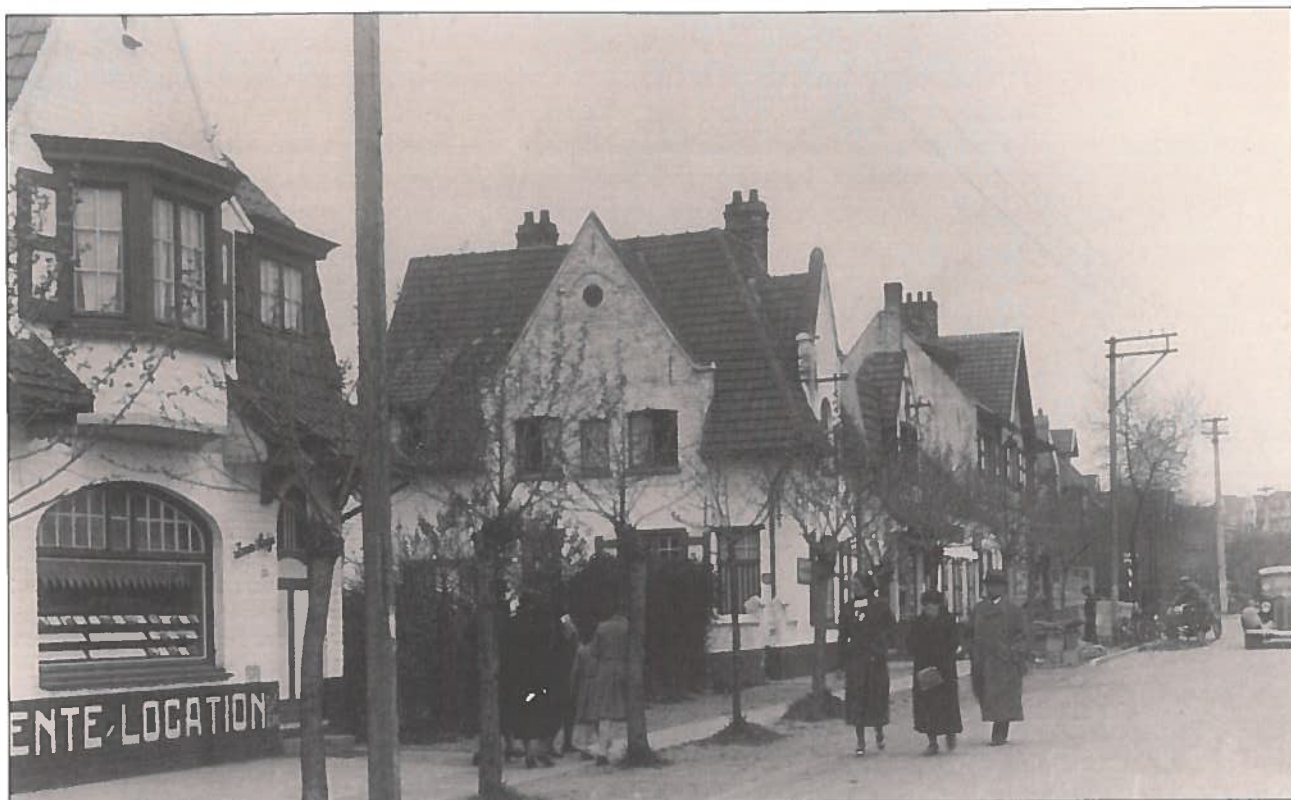
De Sparrendreef in de late jaren '20. Agence Pallen tegenover het Zoutekerkje is nu nog het meest originele gebouw.