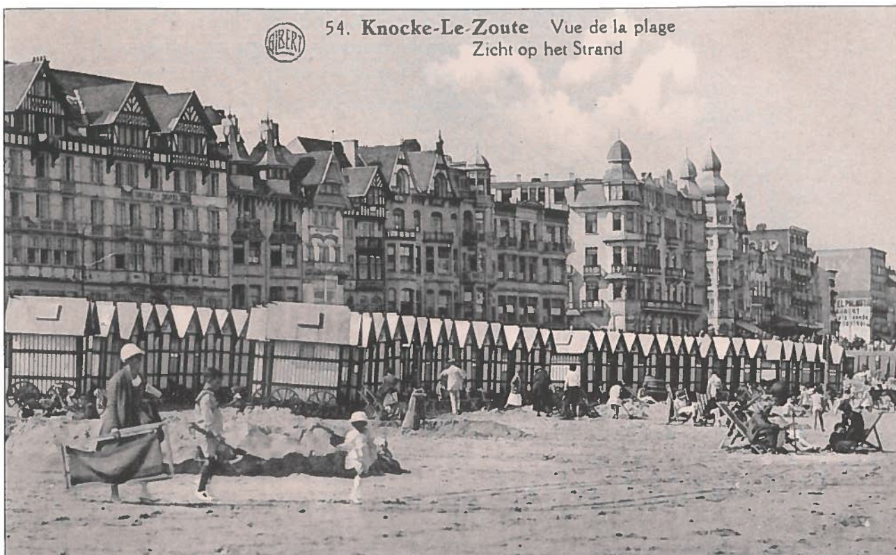
De Zeedijk in het Zoute ter hoogte van het grote hotel Jacobs. De badhokjes waren de voorlopers van de bad-installatie van het Zoute. Rechts springen in het oog de byzantijnse torentjes van de hotels 'Excelsior' en 'Splendid'.