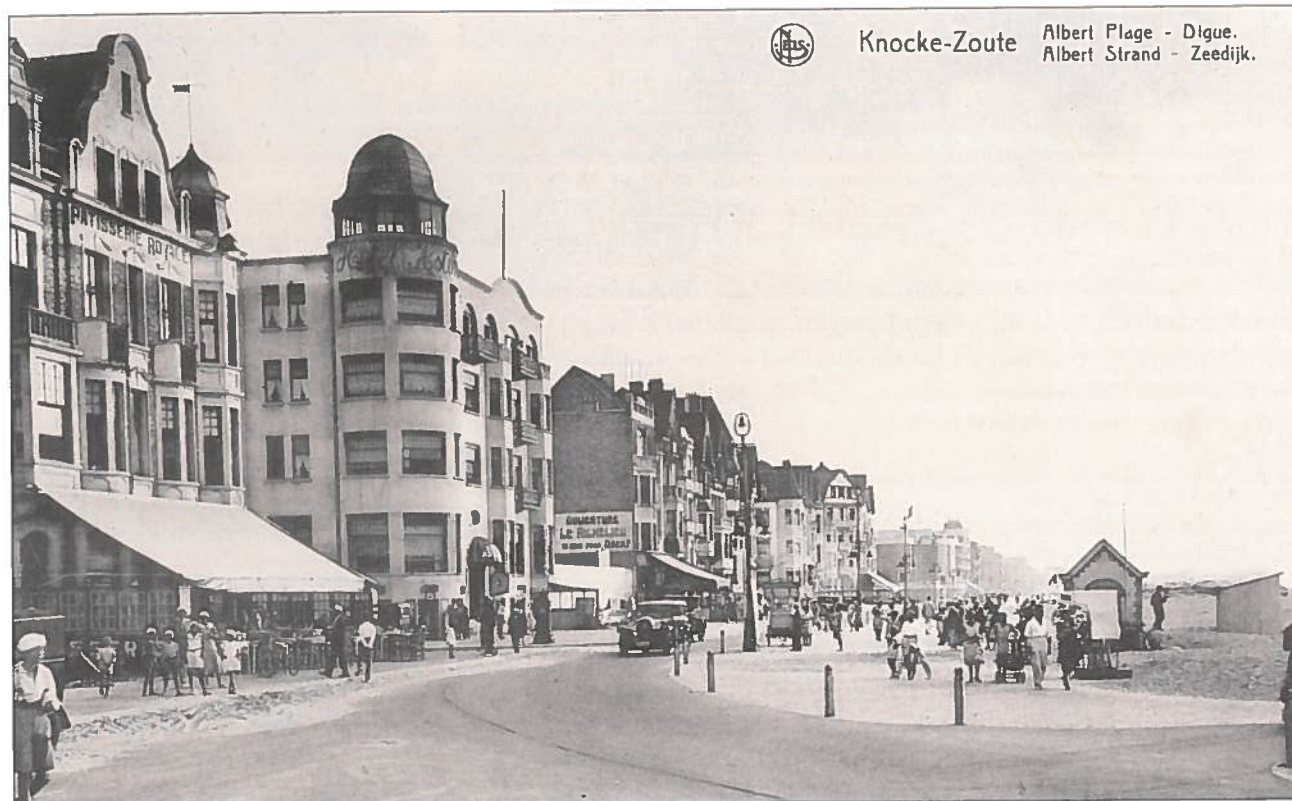
Albertstrand in de jaren '30. Op de hoek met de Meerminlaan zien we het 'Astoria Hotel' met imposant torentje. Links de Patisserie 'Royal'.