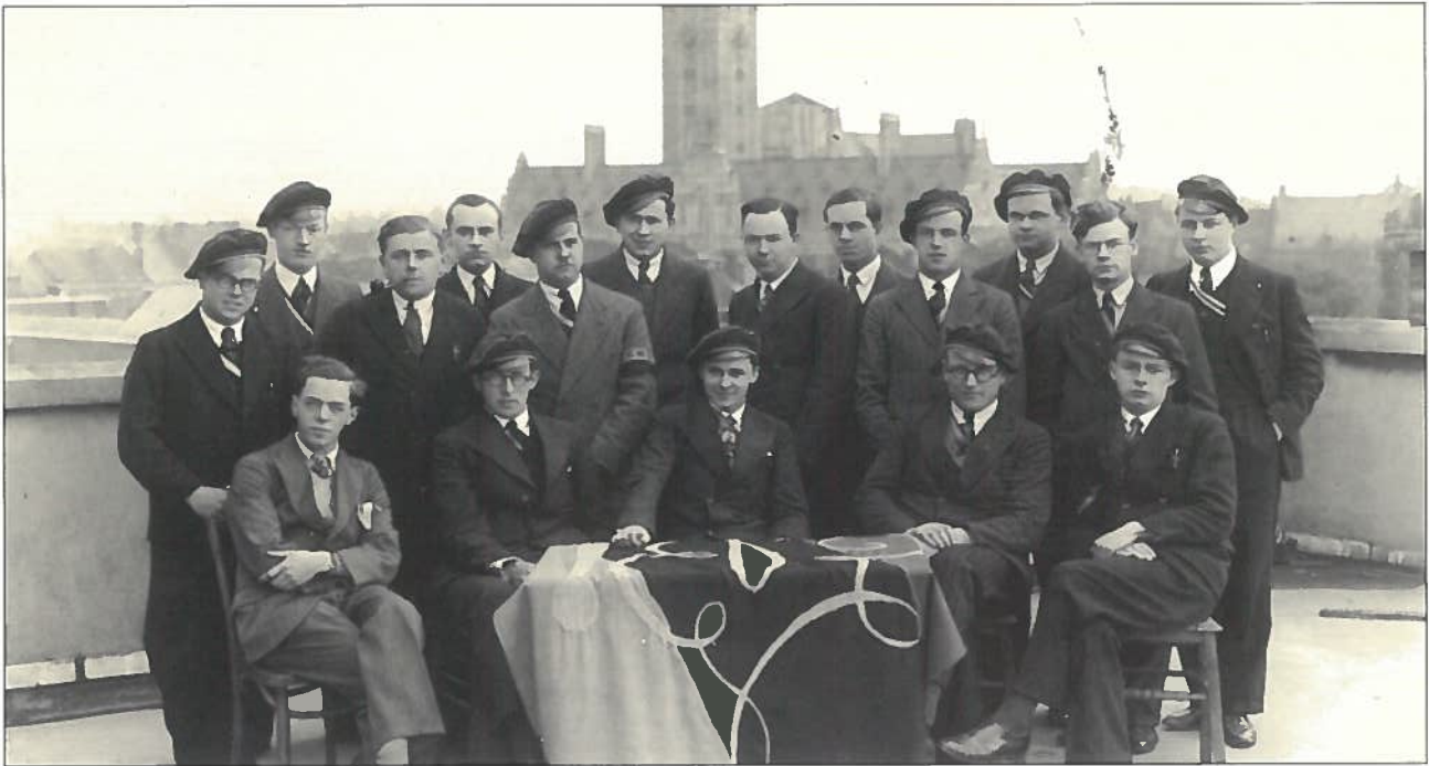
Praesidium Verbond 1934-35.