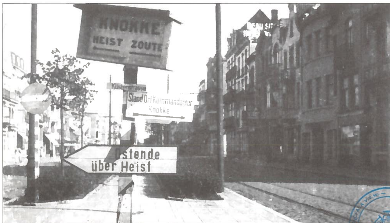
De Lippenslaan tijdens WO II.

E. Mattelaer, Als 't Gemeen U roept, 40 jaar politieke inzet , Knokke (1991).